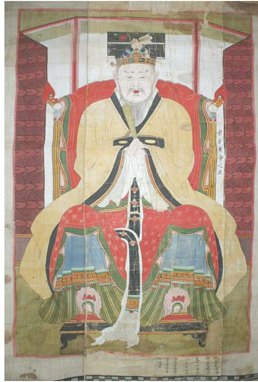
보물 제1765호 서산 개심사 오방오제위도 및 사직사자도-황제지군