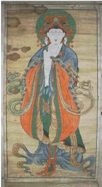
보물 제1766호 서산 개심사 제석, 범천도 및 팔금장, 사위보살도-범천도