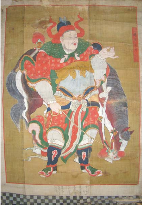
보물 제1765호 서산 개심사 오방오제위도 및 사직사자도-시직사자