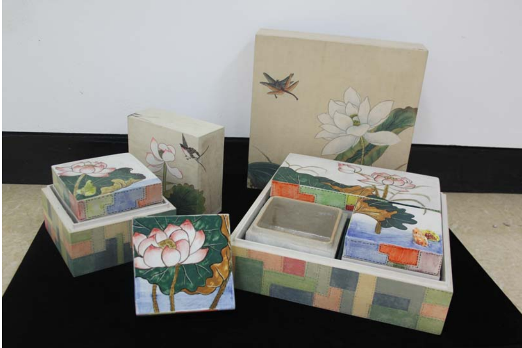
< 문화재청장상 (엄마를 위한 연화도 보석함 세트, 박도연)>