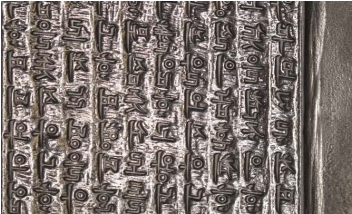
보물 제1754호 '불설대보부모은중경판'