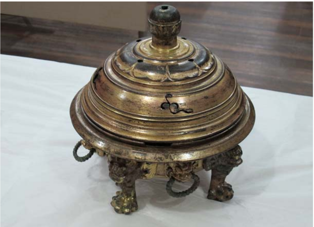
보물 제1753호 '익산 미륵사지 금동향로'