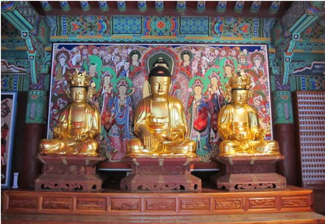
보물 제1750호 '경산 경흥사 목조석가여래삼존좌상'