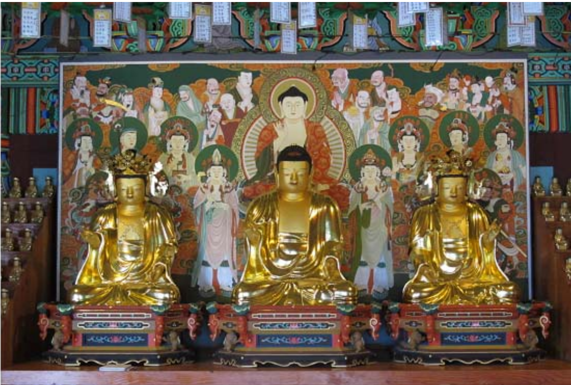
보물 제1751호 '서천 봉서사 목조아미타여래삼존좌상'