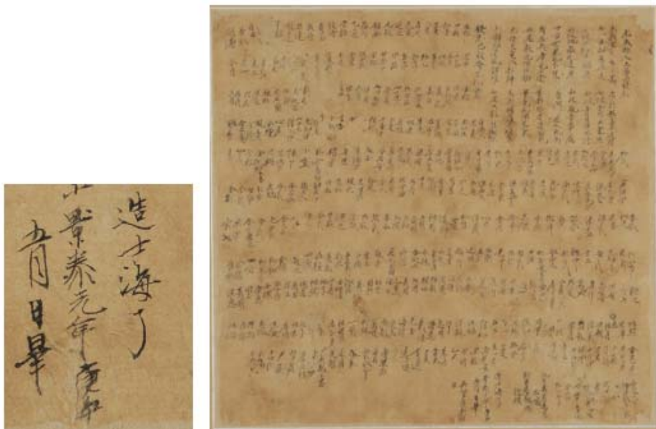
보물 제1747호 '양산 통도사 은제도금아미타여래삼존상 및 복장유물' 중 발원문