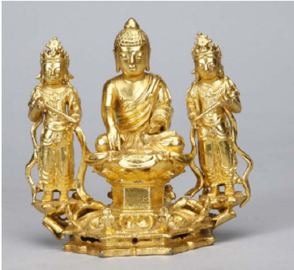
보물 제1747호 '양산 통도사 은제도금아미타여래삼존상 및 복장유물'