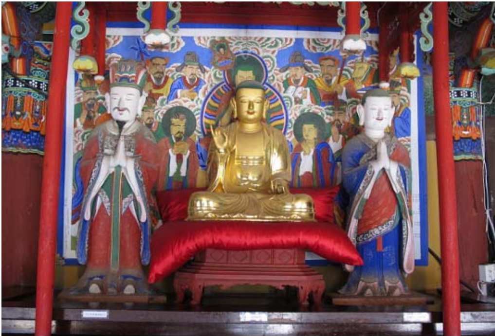
보물 제1749호 '속초 신흥사 목조지장보살삼존상'