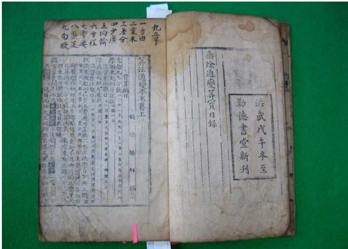
보물 제1755호 '양휘산법'