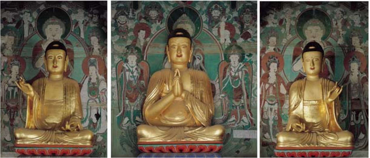
보물 제1752호 '고창 선운사 소조비로자나삼불좌상'