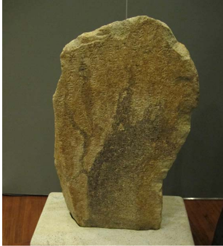
보물 제1758호 '포항 중성리 신라비'