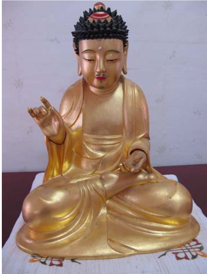
보물 제1748호 '문경 봉암사 목조아미타여래좌상 및 복장유물'