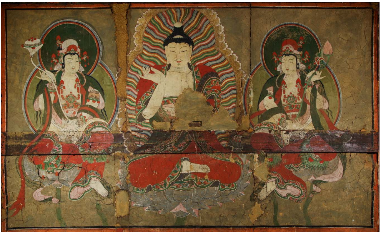
보물 제1757호 '양산 신흥사 대광전 벽화'의 동벽 약사여래삼존도