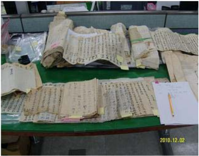
회수한 유물 정리 및 감정 실시