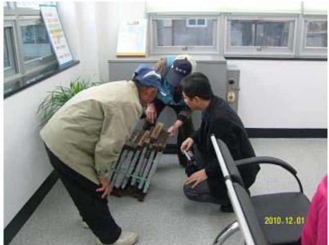
죽로선생목판 피해자 확인(경북 영덕군 창수면 미곡리 미산사)