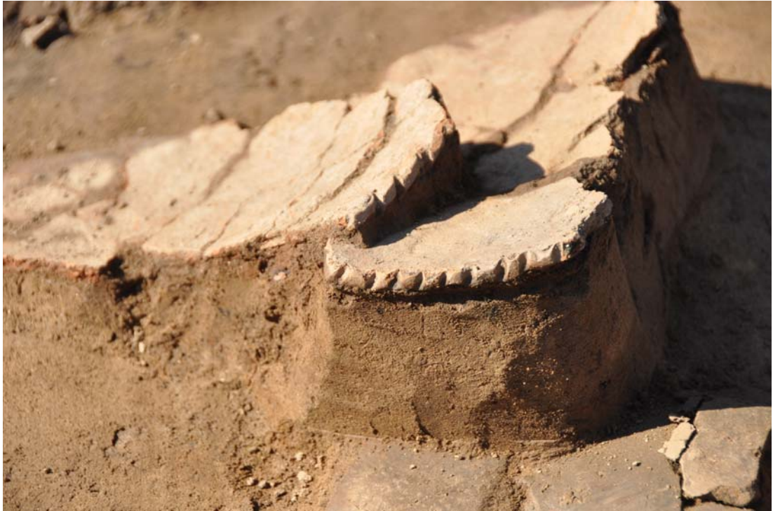
2-6호 수혈 건물지 북벽 중앙부 부근 구순각목토기 출토 모습