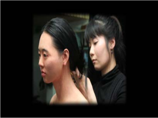
'현재'전 중(가야소녀 복원과정 영상)

문화재행정 50년 각종 사료를 입체적으로 엮어 문화재청이 걸어온 역사적 발자취를 돌아보고 문화재정책의 새로운 비전을 제시