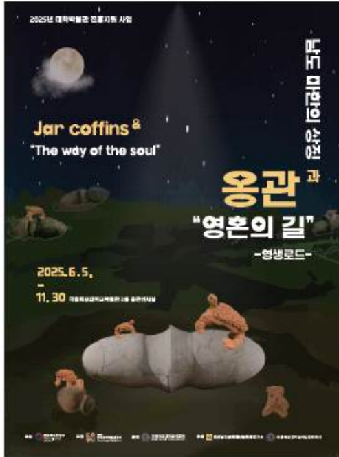
남도 마한의 상점 영관 특별전