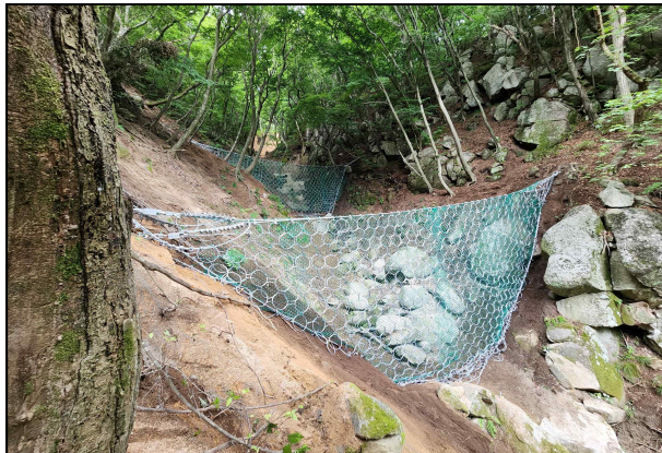
<낙석2구간 토석류 방지망>