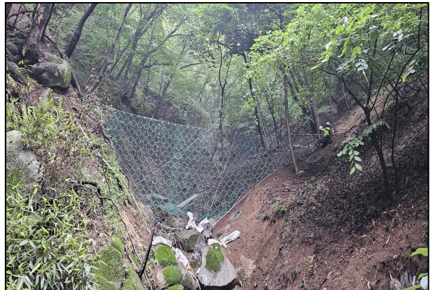
<낙석1+2구간 토석류 방지망>