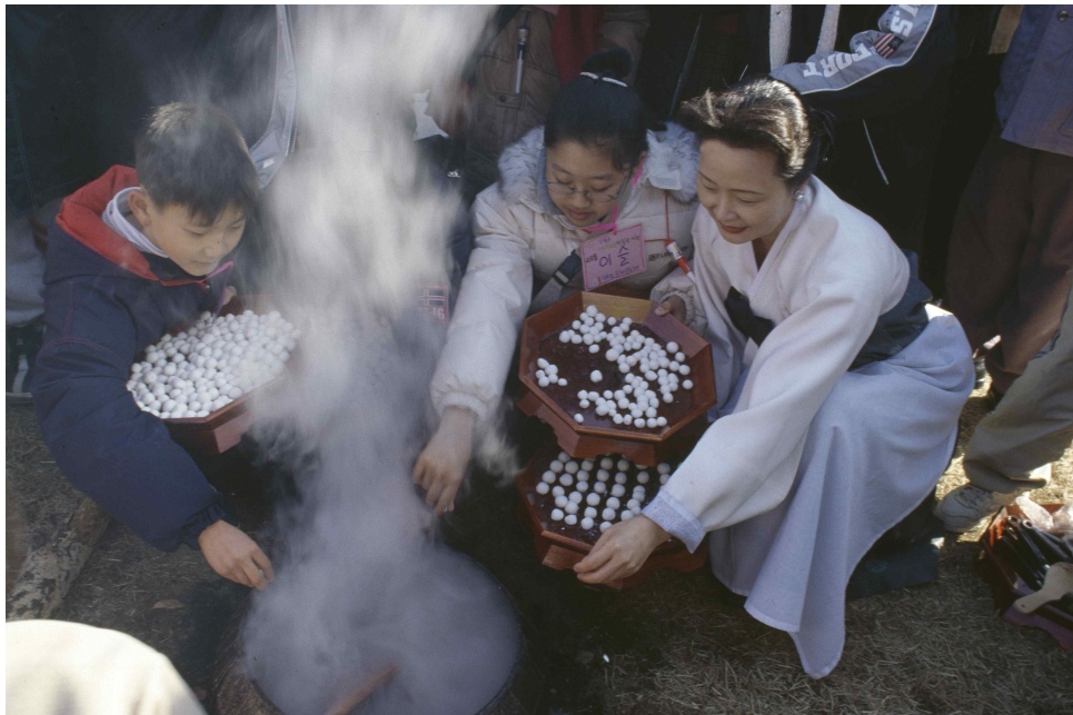
<팥죽에 새알심 넣기>