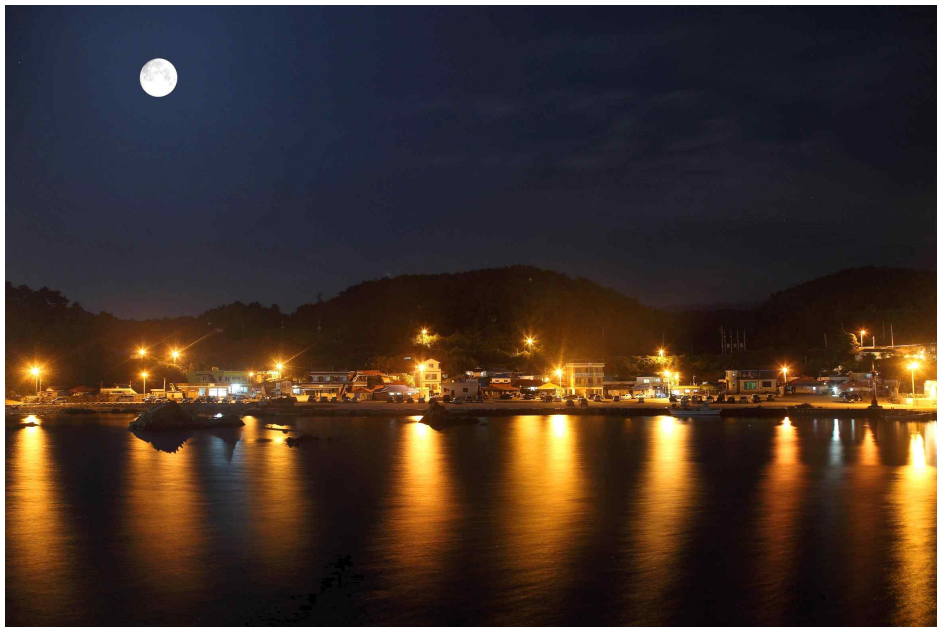
<추석날 보름달과 마을 야경>