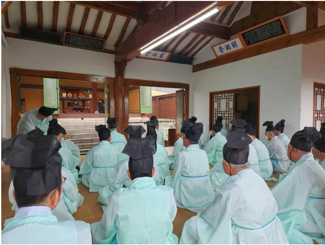
<한식 제사(경기도 고양시)>