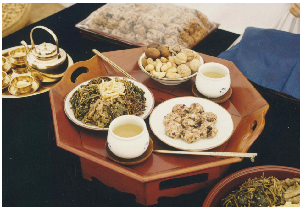
<정월대보름 오곡밥과 부럼 상차림>