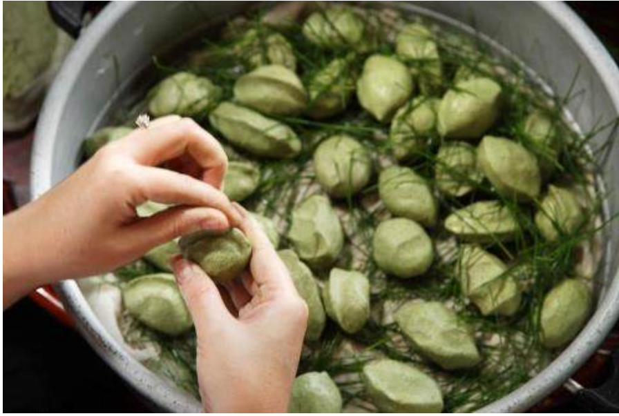
<추석 송편 빚기(충남 당진 남이홍 종가)>