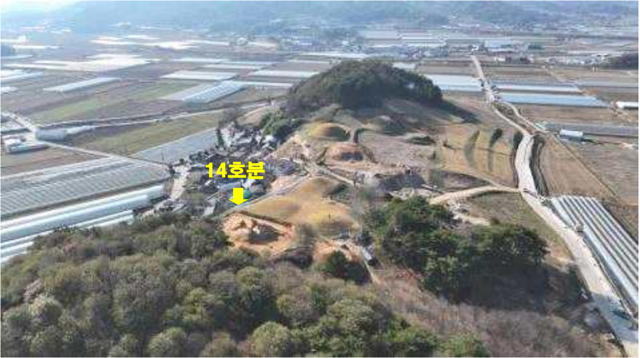
<남원 유곡리와 두락리 고분군 전경>