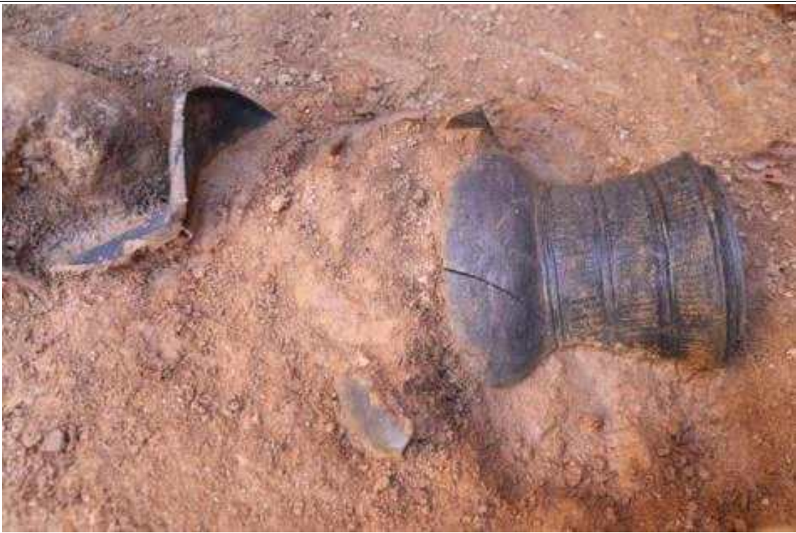
<14호분 수혈식 석곽묘 출토 발형기대, 유개장경호>