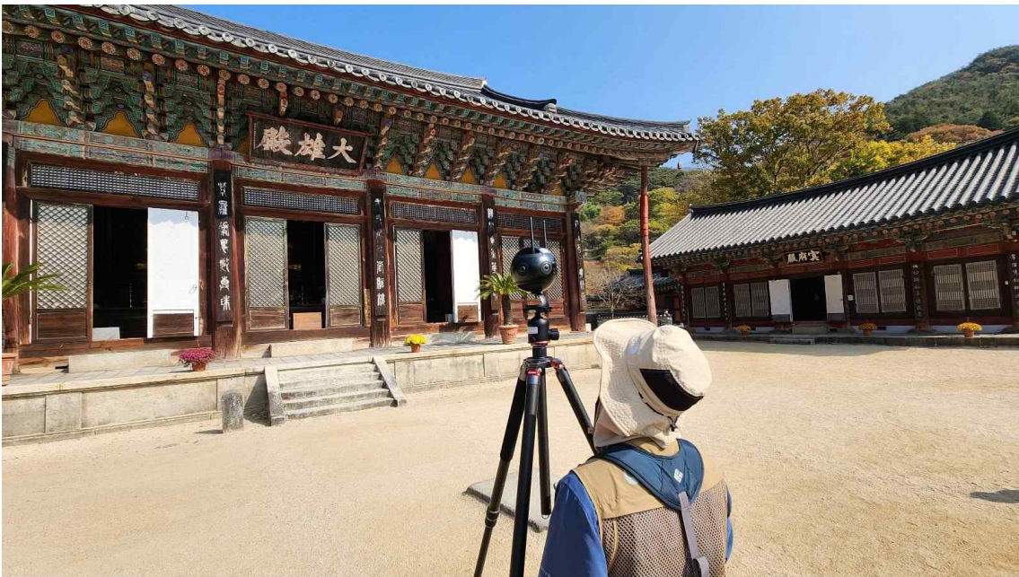
< 안전점검 모습(구례 화엄사 대응전) >