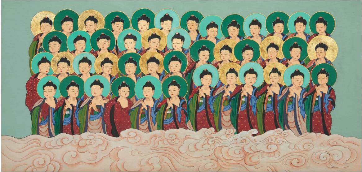
<(단청) 해남 미황사 대웅보전 천불도 중 45불 재현>