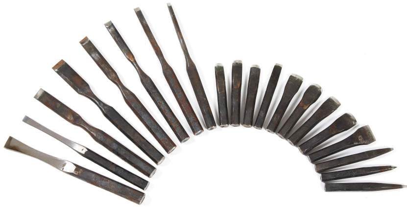
<(철물) 전통 철물 및 정 세트>