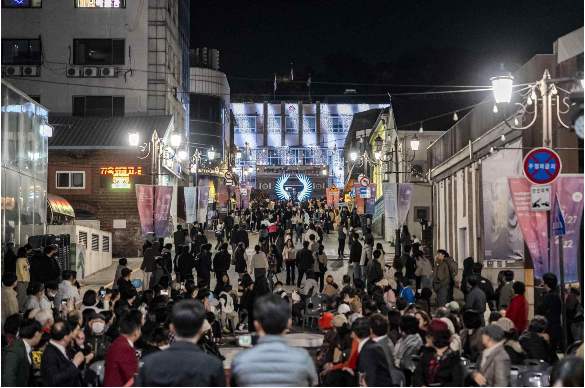
< 인천개항장 문화유산 야행 (인천 중구) >