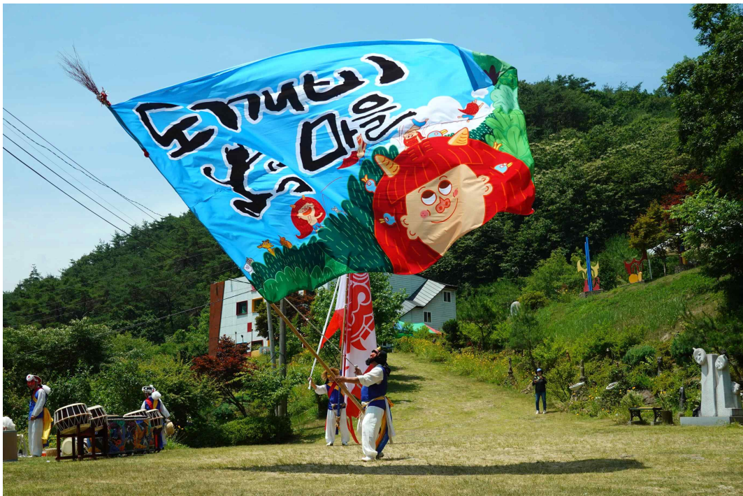
< 섬진강 도깨비마을 (전남 곡성군) >