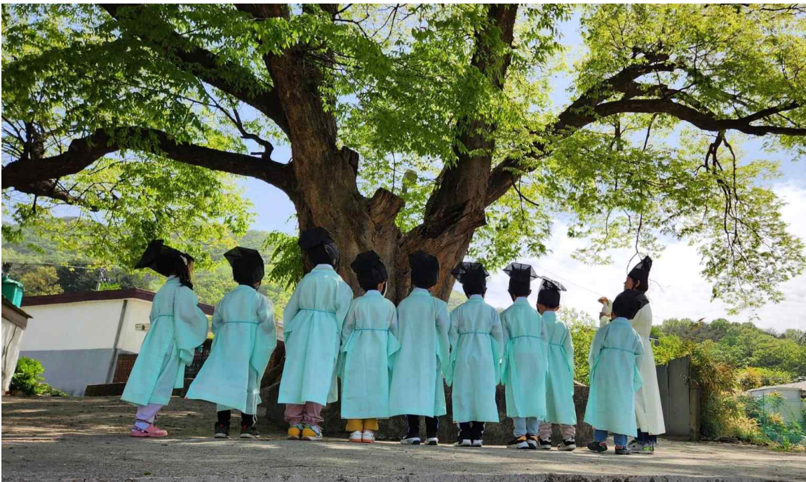
< 신항서원 휴식시대 (충북 청주시) >