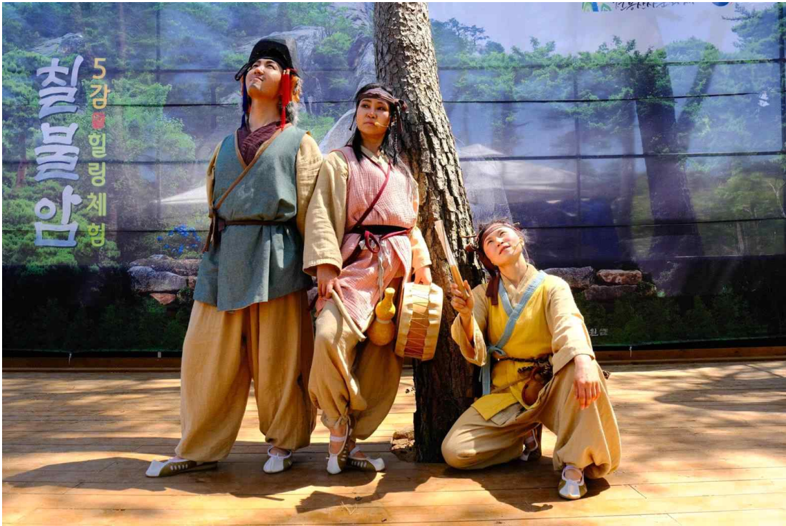
< 칠불암 5감 힐링체험 (경북 경주시) >