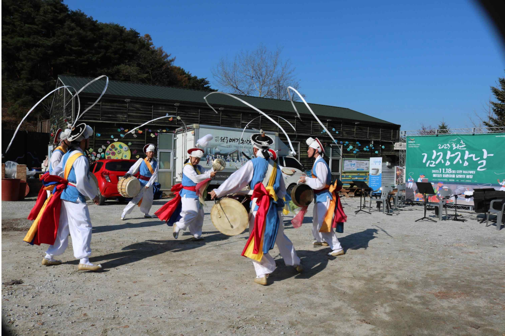
< 원주 매지농악과 생기복덕 생생문화유산 마을 만들기 (강원 원주시) >