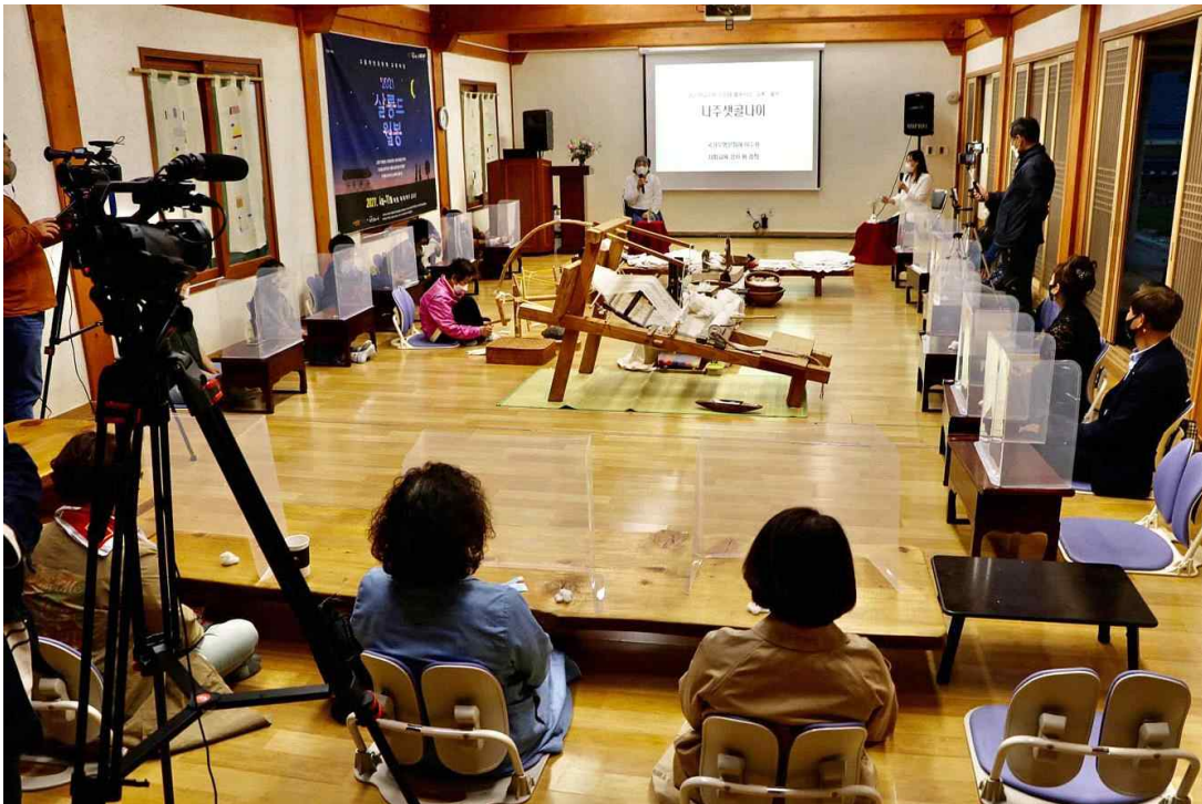
< 달의 정원, 월봉서원 (광주 광산구) >