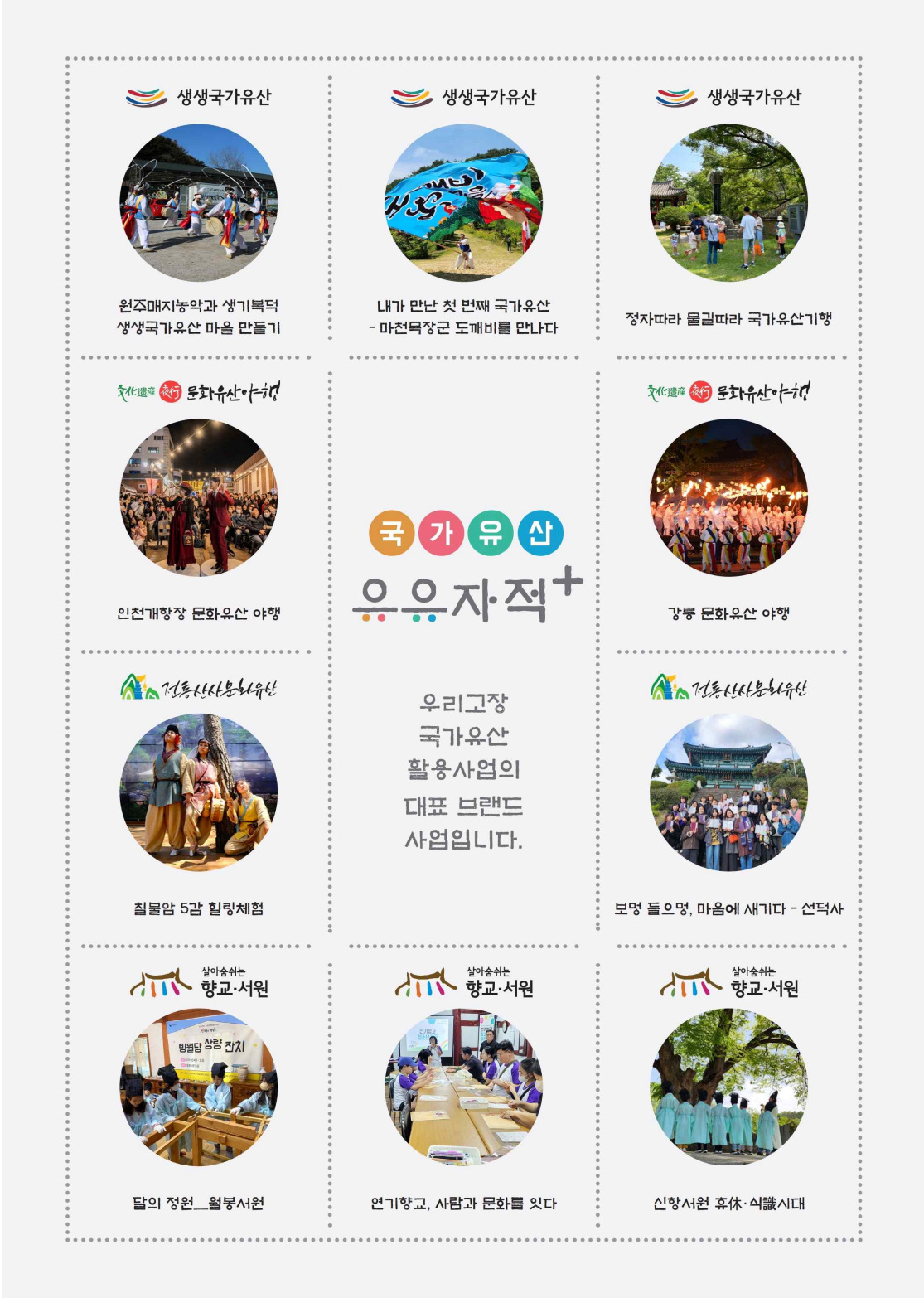
< 우리고장 국가유산 활용 대표 사업 10선 포스터 >