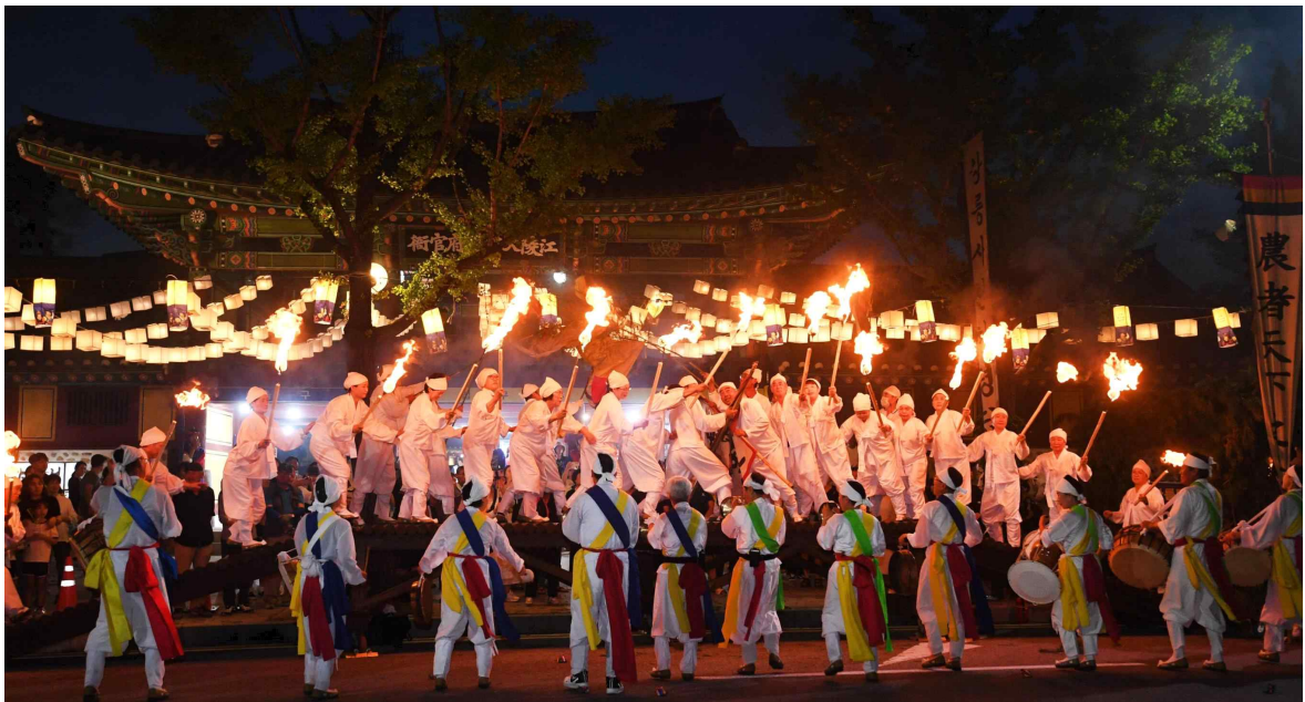
< 강릉 문화유산 야행 (강원 강릉시) >