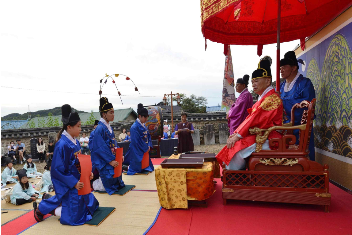
< 연기향교, 사람과 문화를 잇다 (세종특별자치시) >