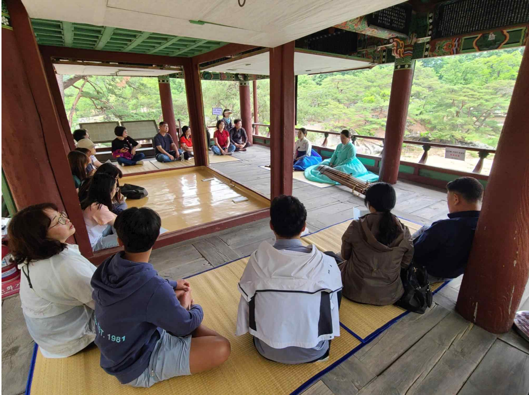
< 정자따라 물길따라 국가유산 기행 (경남 거창군) >