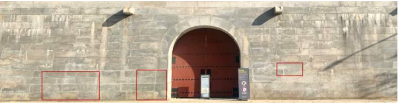
경복궁 영추문 좌·우측 보존처리 구간