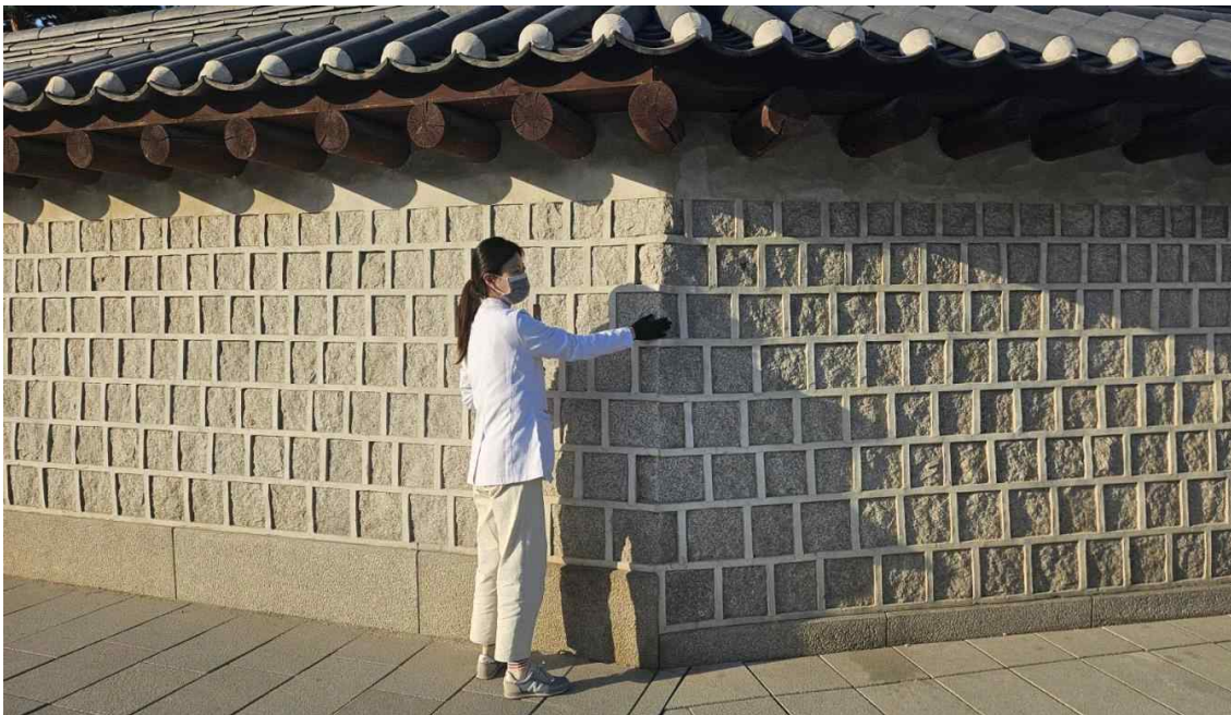
< 긴급 보존처리 후 모니터링 모습 >