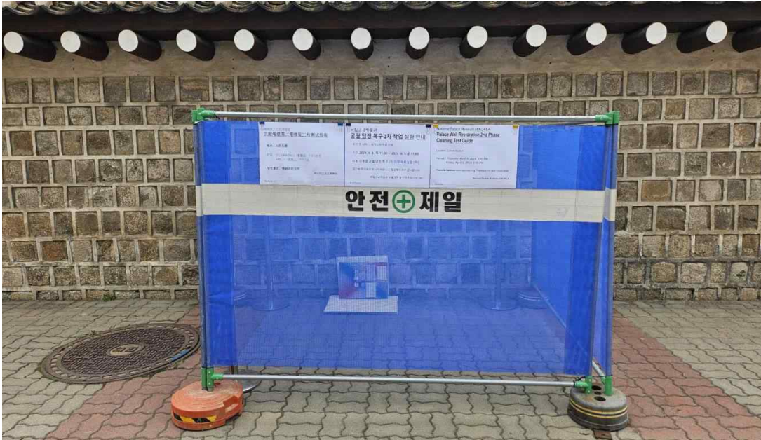
< 2차 보존처리 작업을 위한 예비실험 모습 >