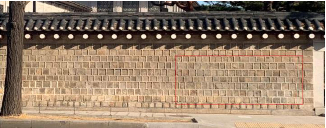
고궁박물관 쪽문 좌측 보존처리 구간