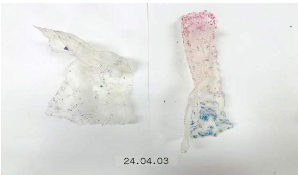
< 2차 보존처리 작업을 위한 예비실험 모습 >