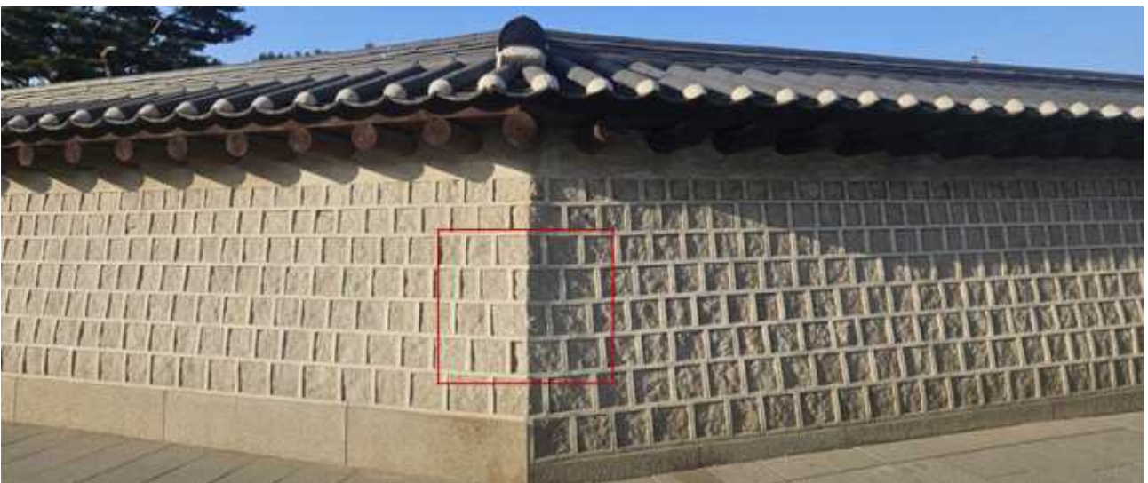
고궁박물관 쪽문 우측 보존처리 구간