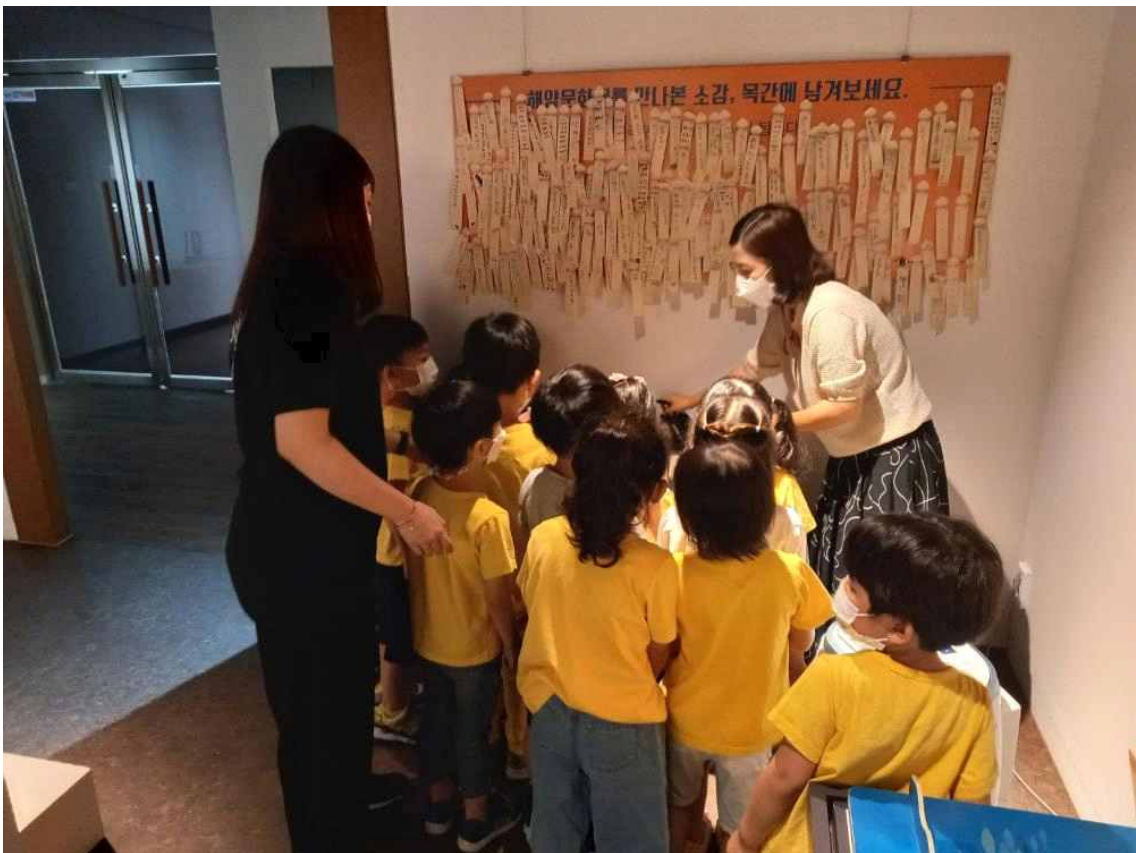
< 찾아가는 해양문화재(체험활동) >