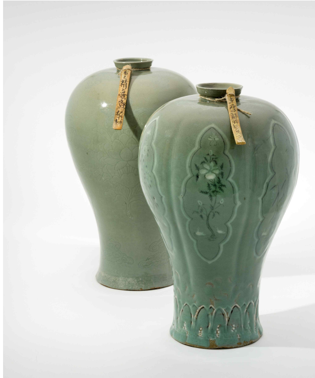
< 청자 상감국화모란유로죽문 매병 및 죽찰 >