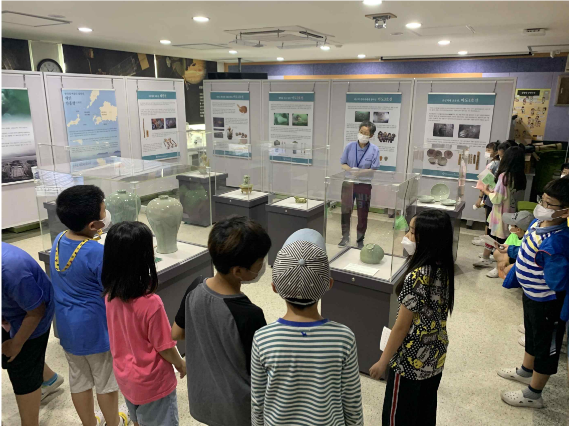
< 찾아가는 해양문화재(전시해설) >