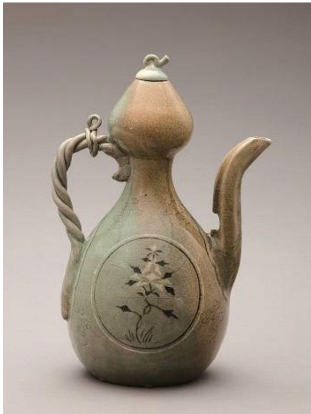
< 청자 모란연꽃무늬 표형주자 >