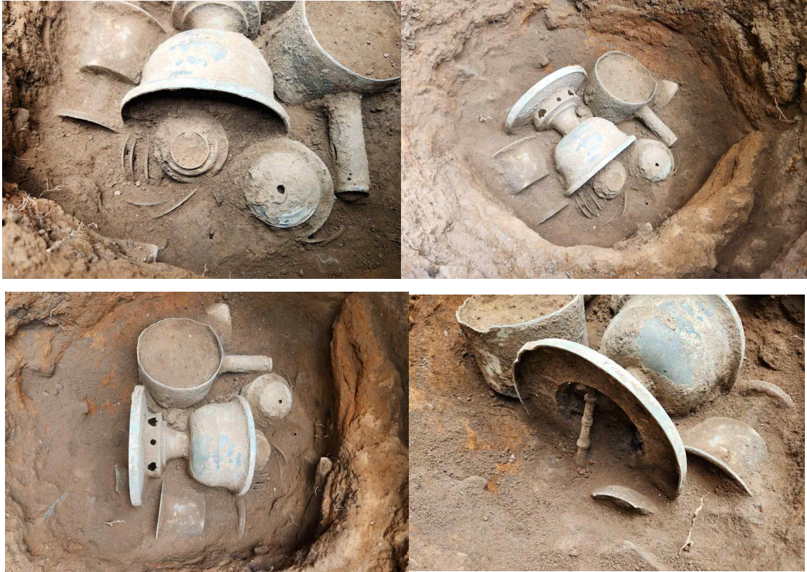
14. 철제 숯 내부 상부 (청동)유물(기수습 유물)