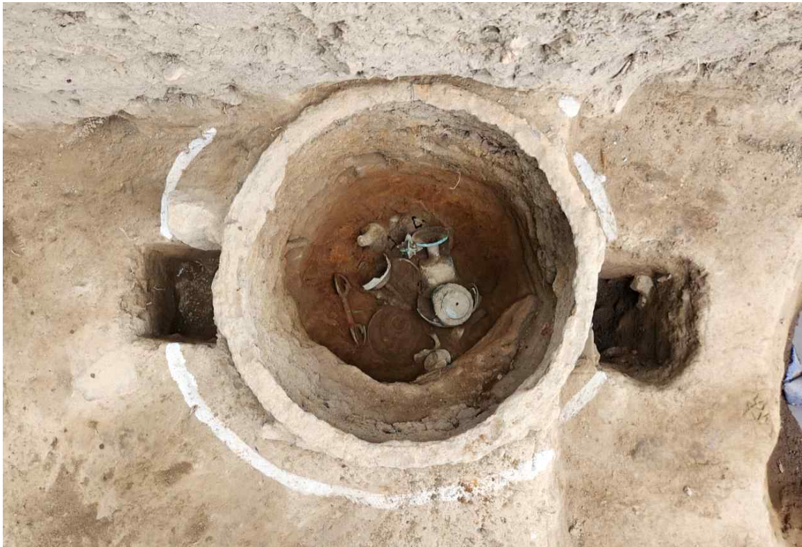
15. 철제 숯 내부 하부 (청동)유물