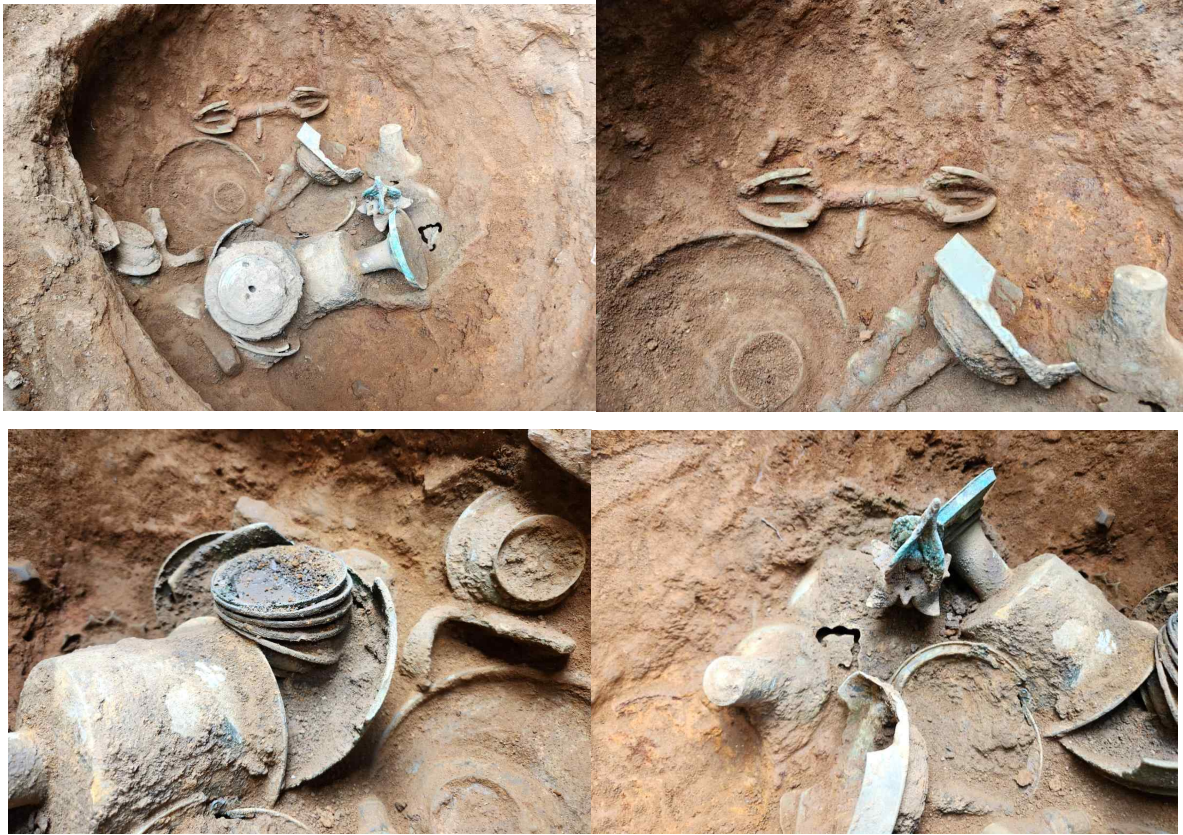
16. 철제 술 내부 하부 (청동)유물 세부(철제 술과 고착)