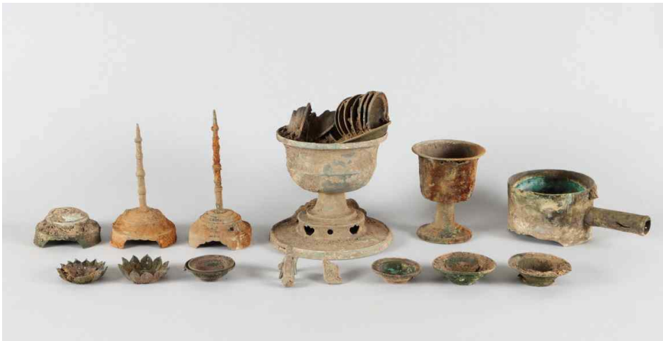
2. 청동 공양구 일괄(일부)