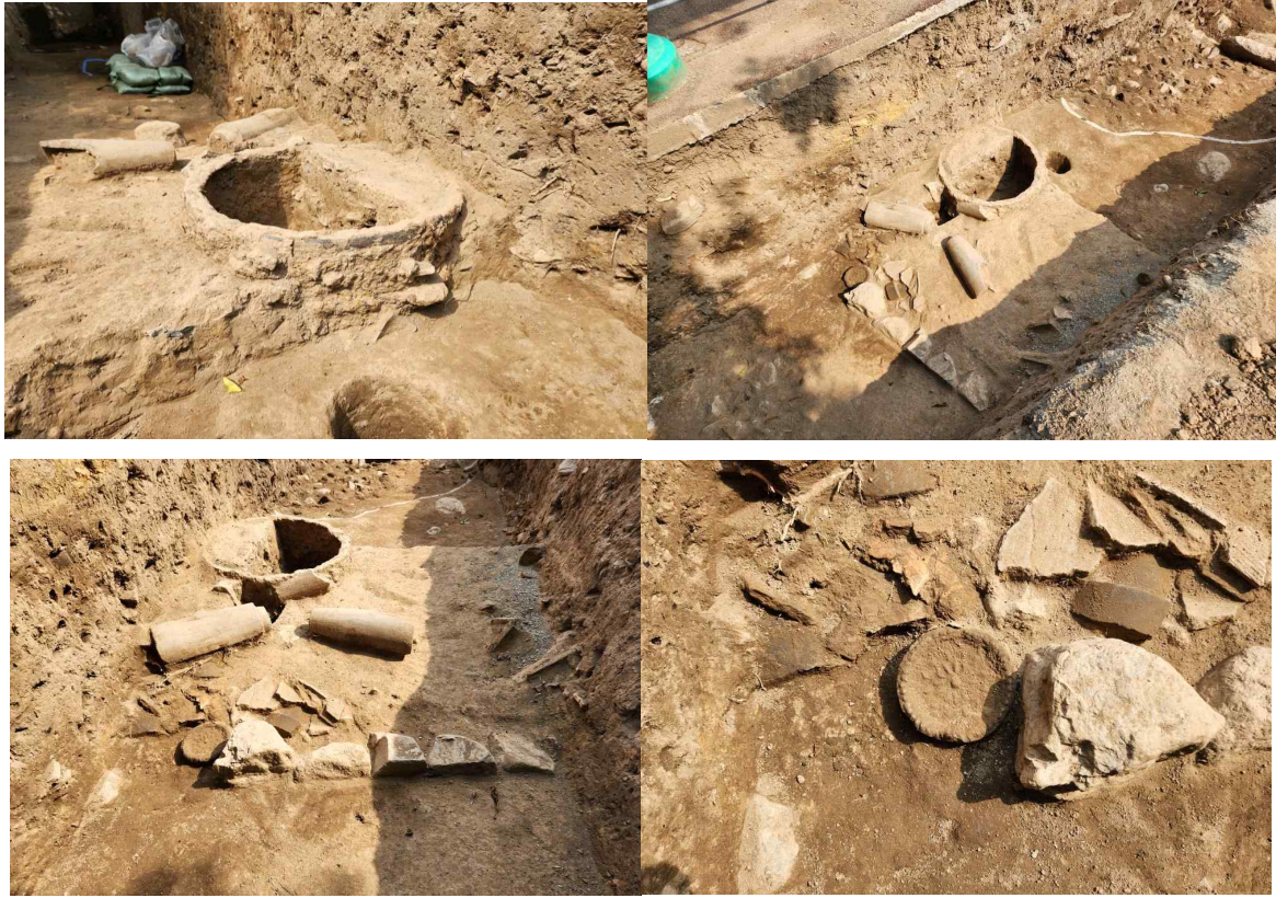
10. 철제 숯 주변 조사모습