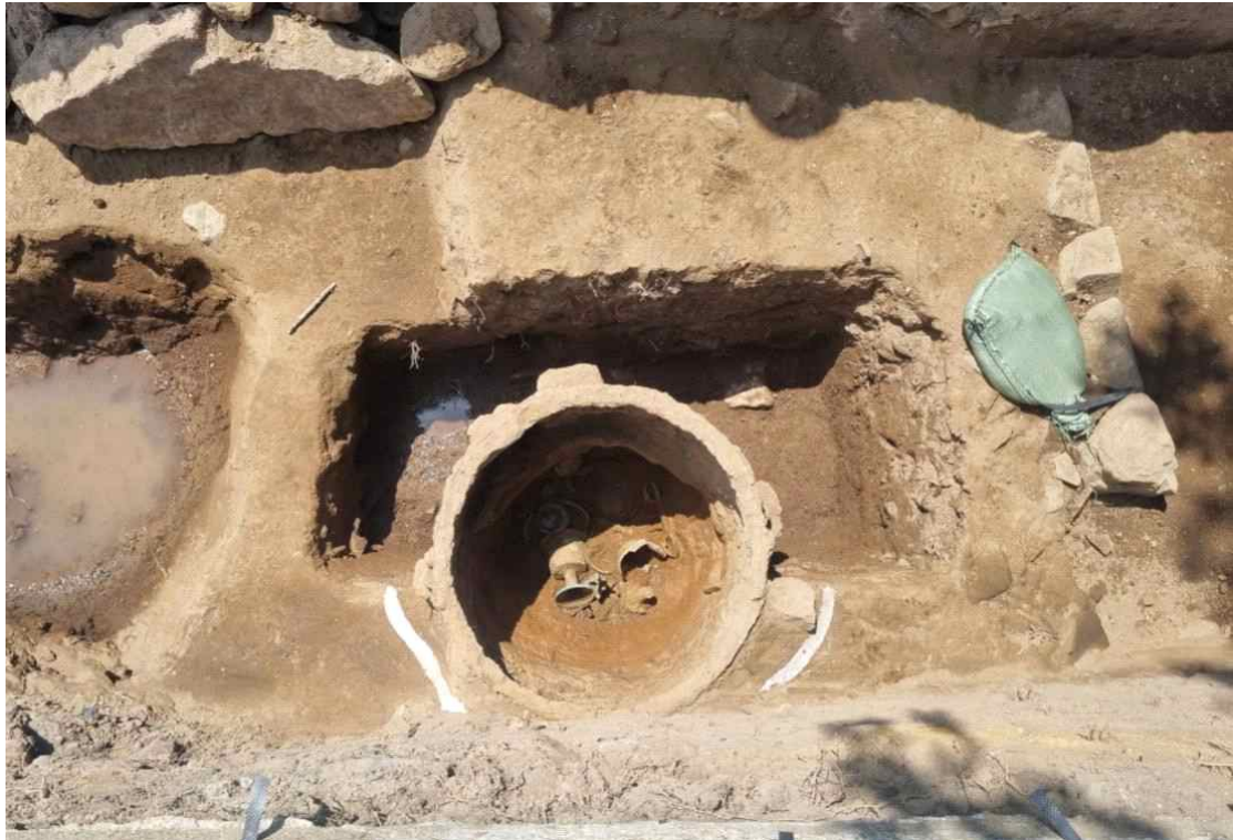
11. 철제 숯 내부 매납 유물 출토 모습