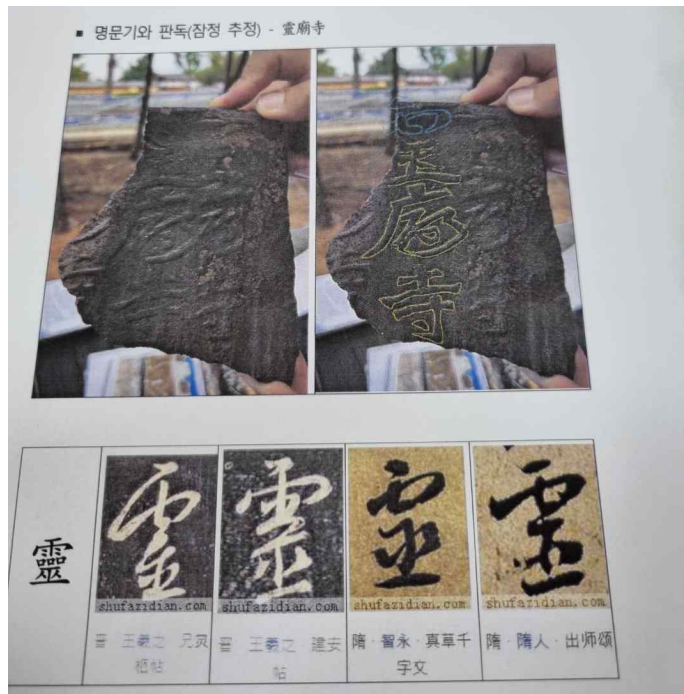
18. 명문 기와 판독 자료