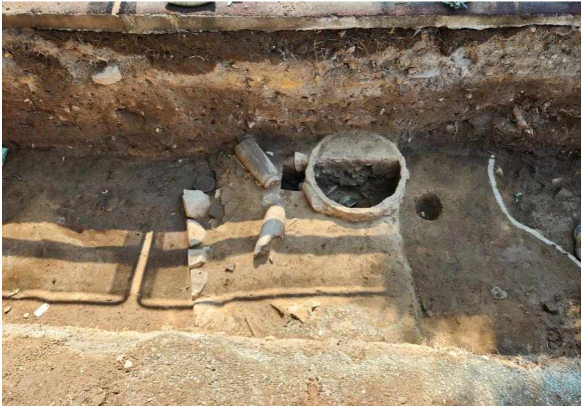
8. 철제 솥 내부 조사 모습