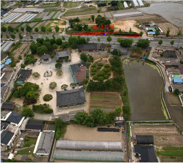
5. 조사지역 항공사진(동->서 촬영)