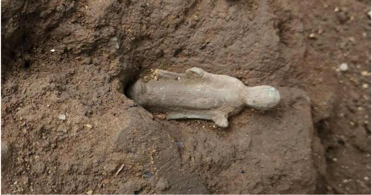
3. 금동여래입상 출토 모습(조사지역 북편 고려시대 담장 주변 발굴)