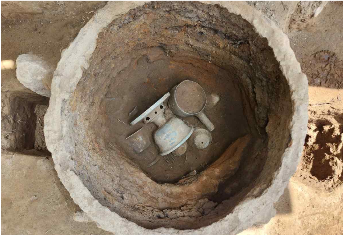
13. 철제 솥 내부 상부 (청동)유물