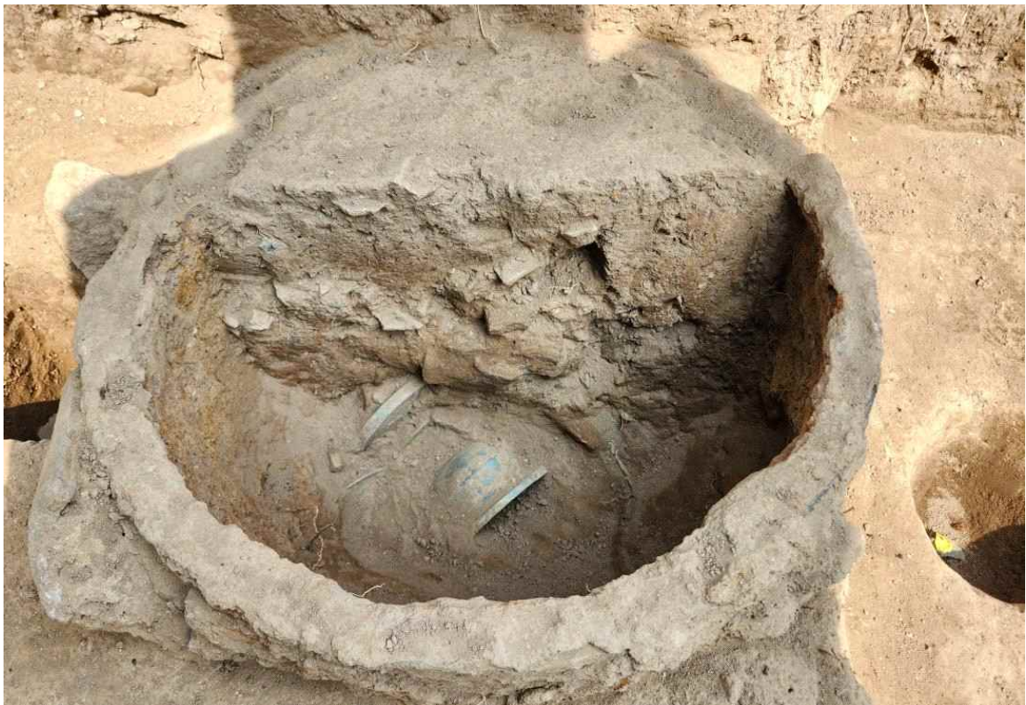
9. 철제 솥 내부 매납 유물 출토 모습