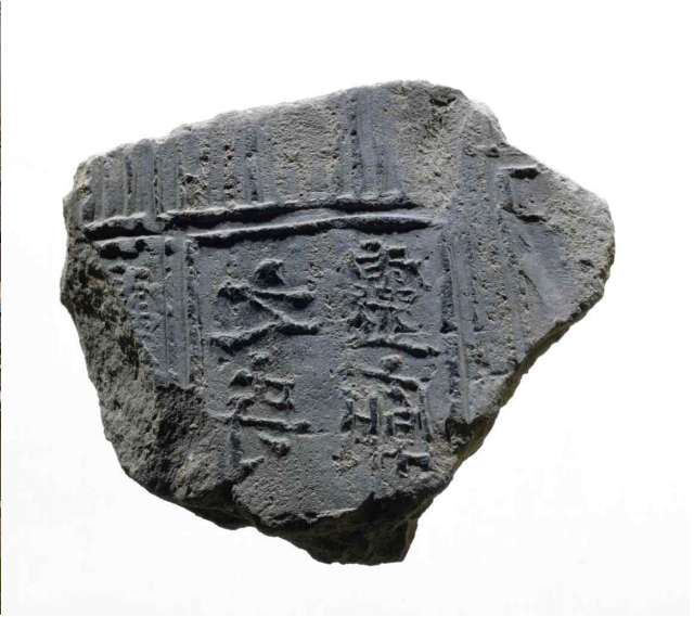
6. '靈廟之寺'명 기와