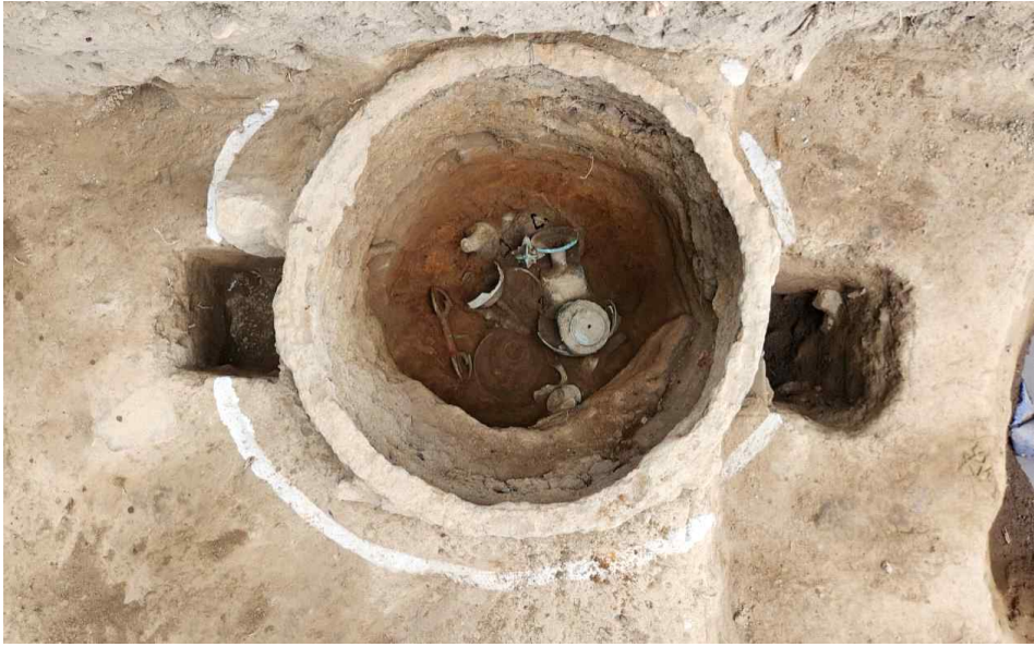
1. 퇴장유물 출토 모습