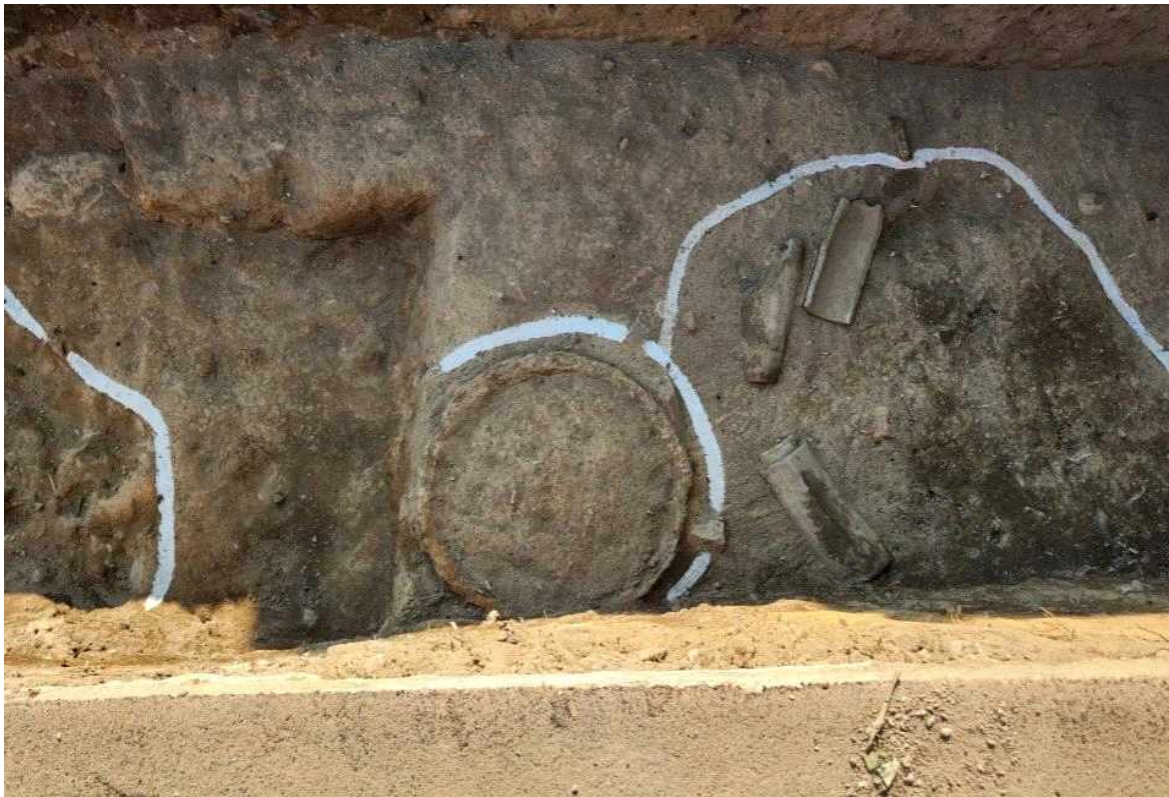
7. 철제 숯 출토 모습