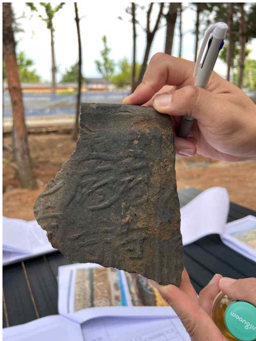
17. 발굴된 (추정)‘靈廟寺’명 기와