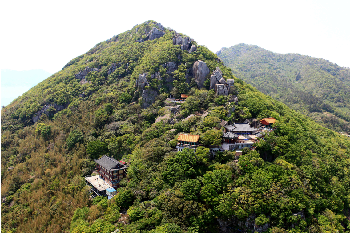
<향일암 일원 전경>