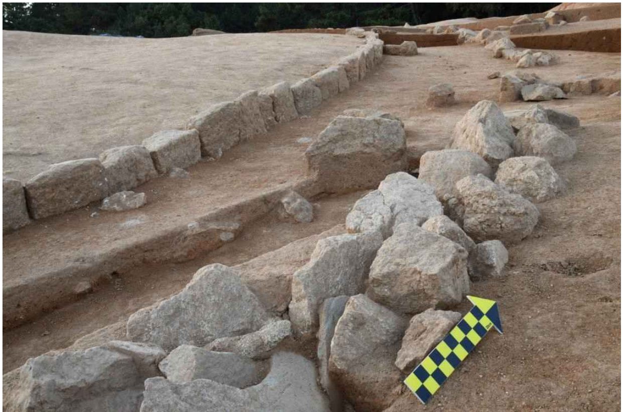
<그림 10. 부여 왕릉원 3호분 호석 열>