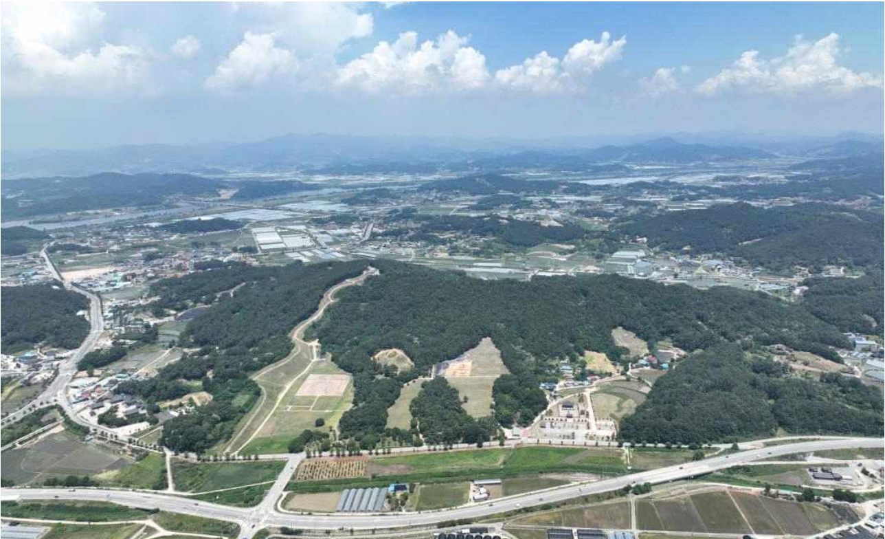
<그림 1. 부여 왕릉원 전경>