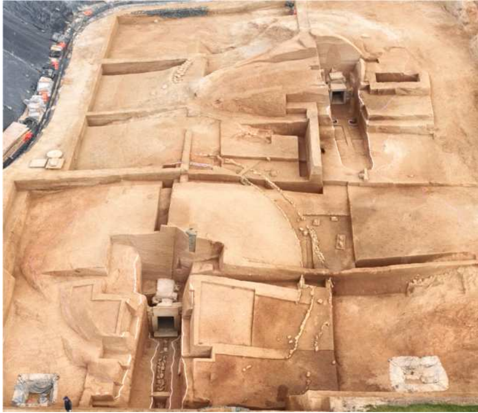
<그림 5. 부여 왕릉원 3·4호분 발굴조사 후 전경>