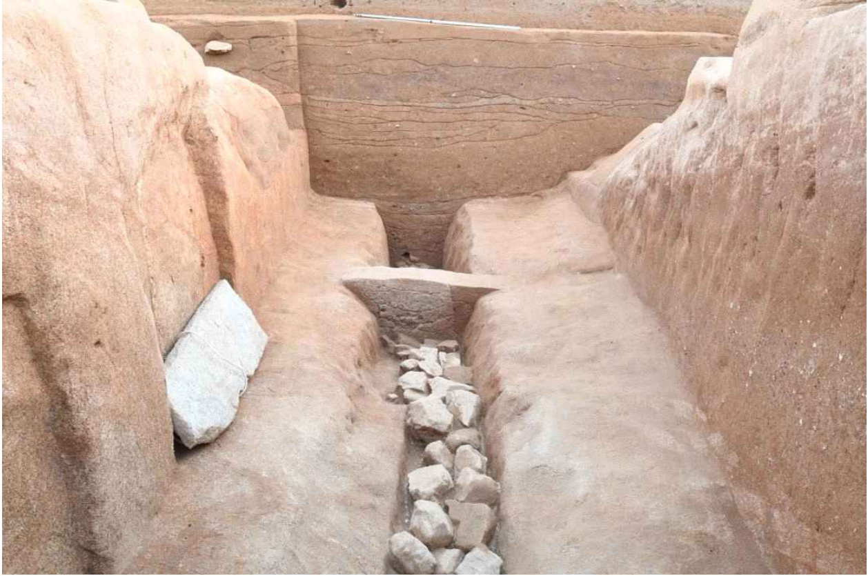
<그림 11. 부여 왕릉원 3호분 배수로>