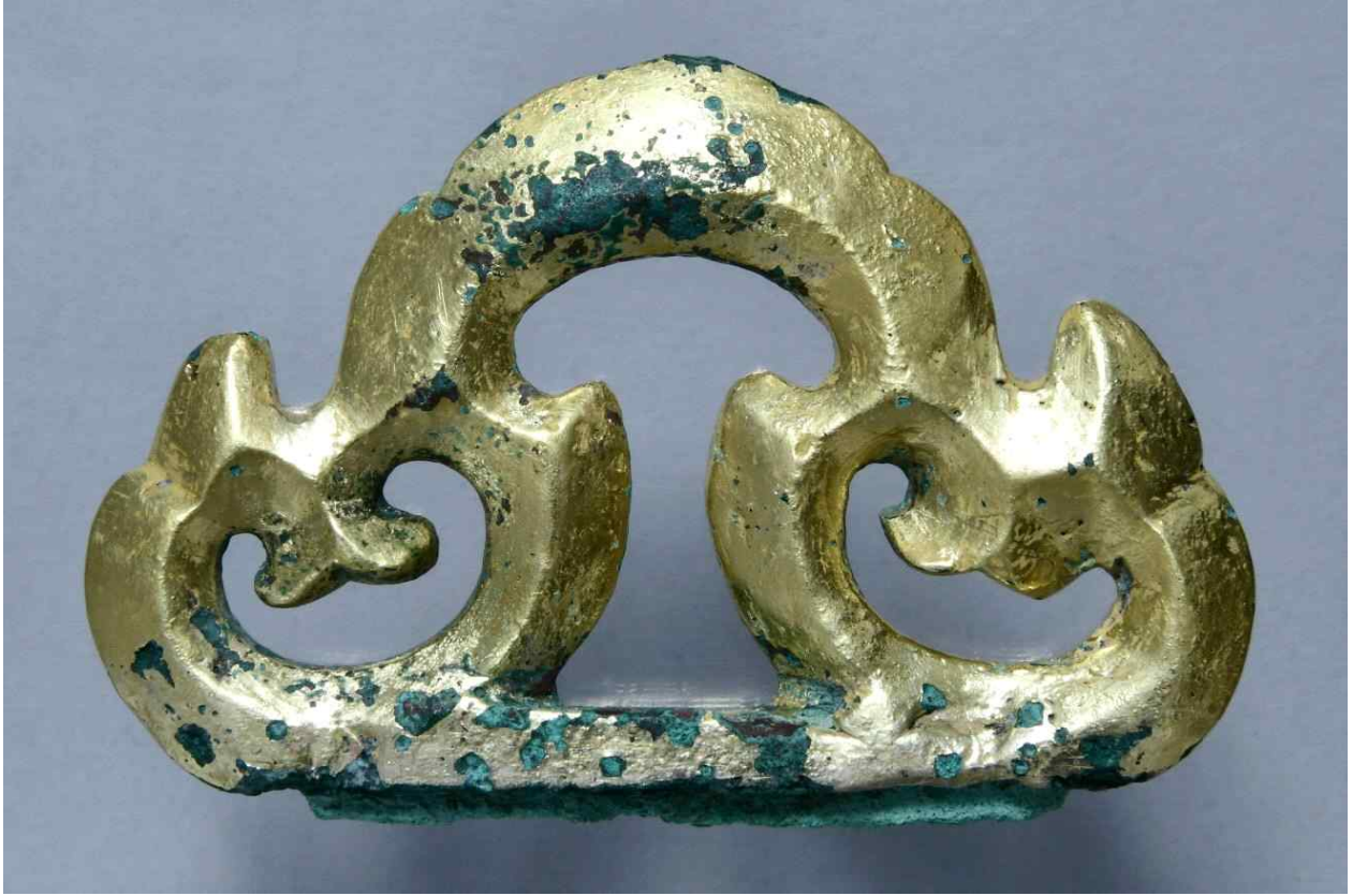
<그림 13. 부여 왕릉원 4호분 도굴갱 출토 목관 장식금구(너비 7.2cm)>