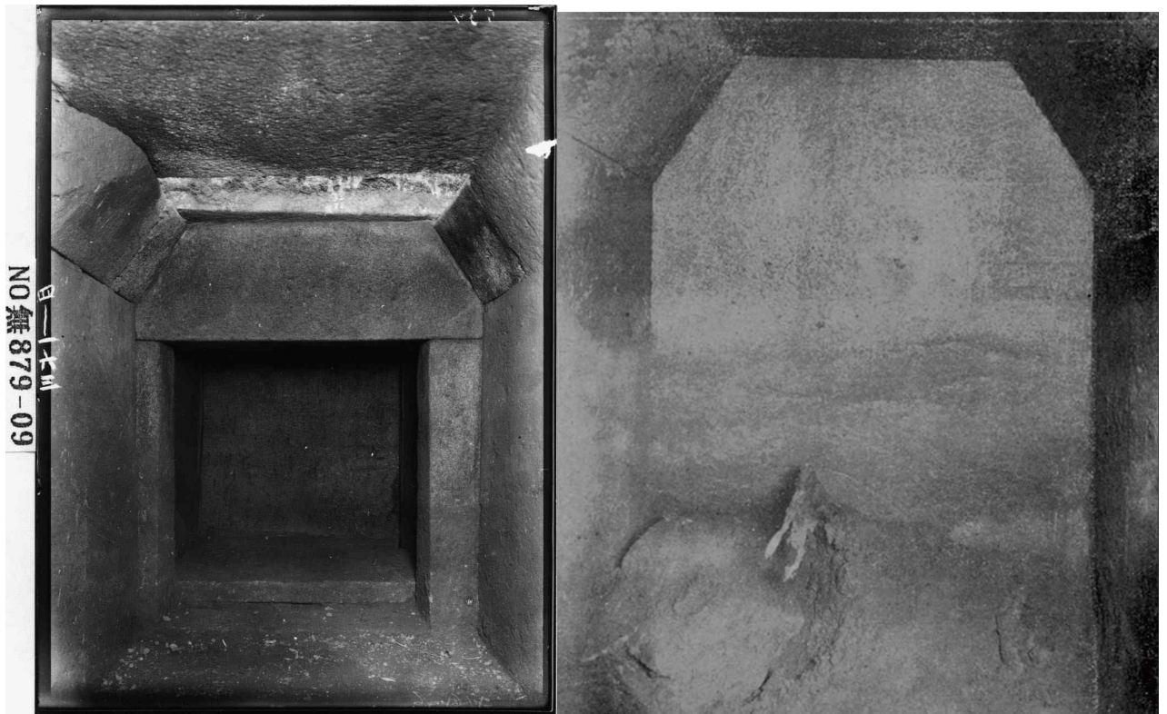
<그림 4. 일제강점기 부여 왕릉원 3호분 돌방 내부 사진(좌: 출입구, 우: 뒷벽)>