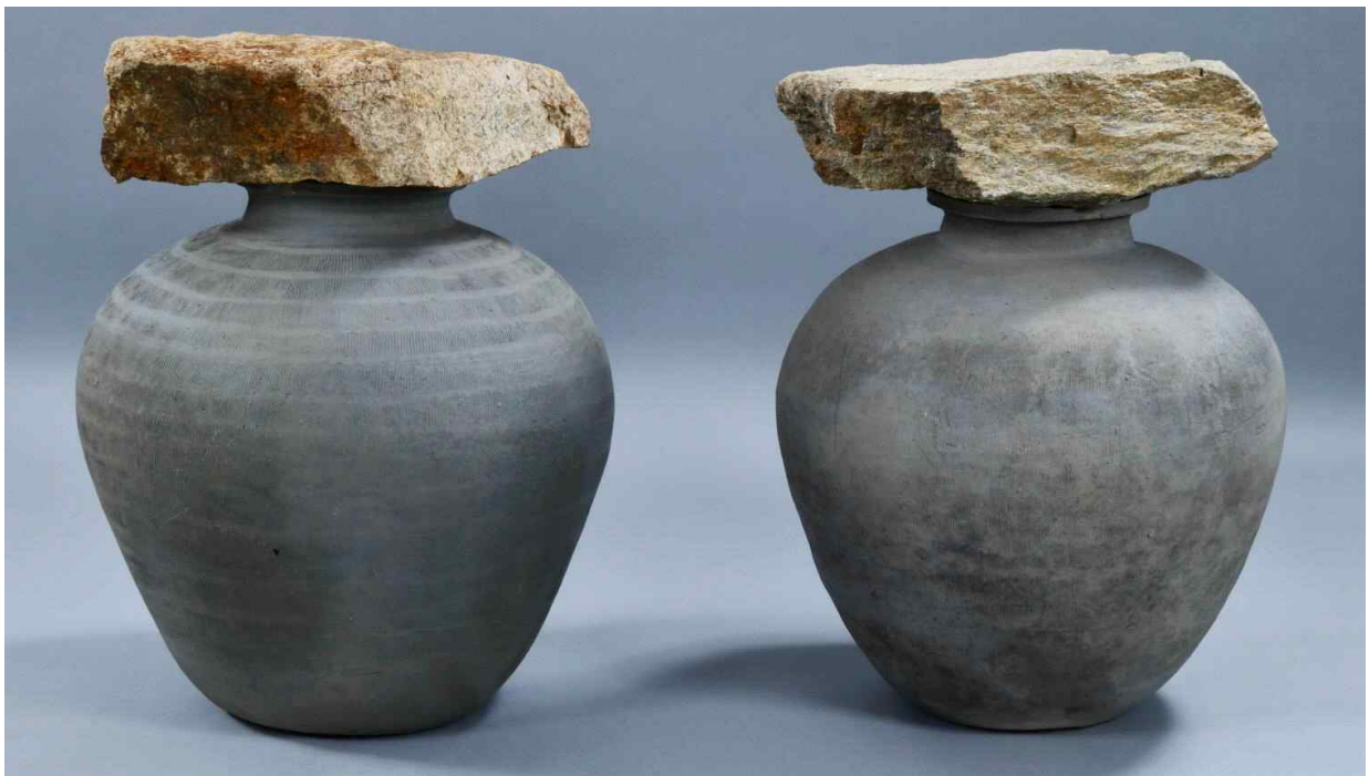
<그림 12. 부여 왕릉원 4호분 널길 매납 대형 항아리(높이 48.8cm)>