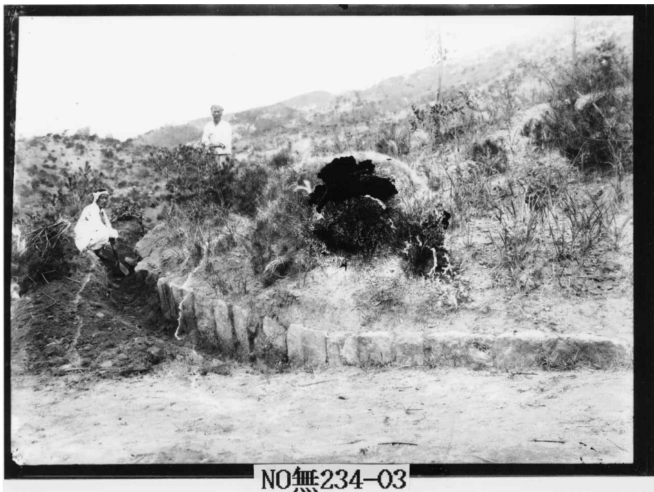
<그림 2. 일제강점기 부여 왕릉원 4호분 조사사진(호석)>