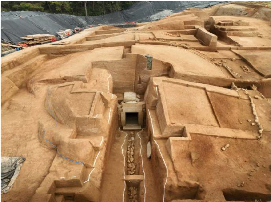
<그림 6. 부여 왕릉원 3호분 조사 후 전경>