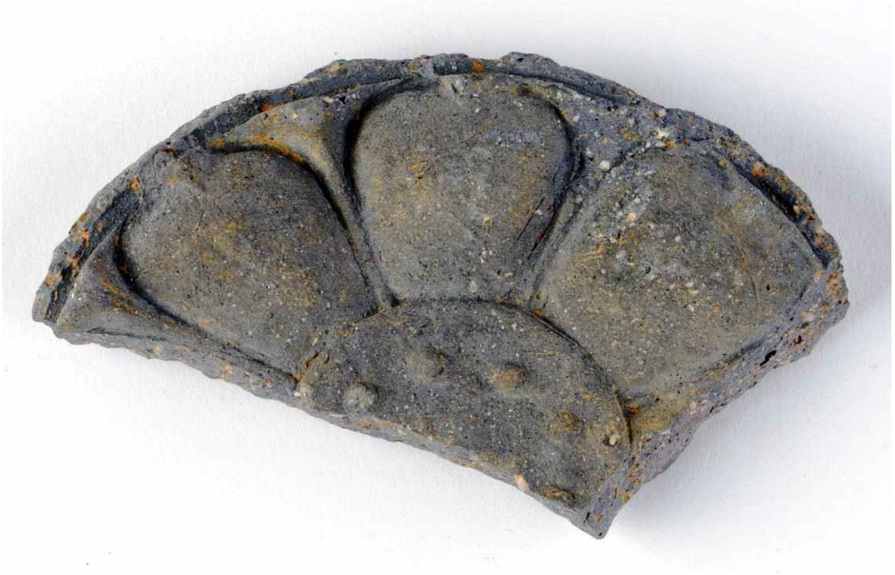
<그림 14. 부여 왕릉원 3호분 널길 채움토 출토 연화문수막새(자방 너비 4.5cm)>