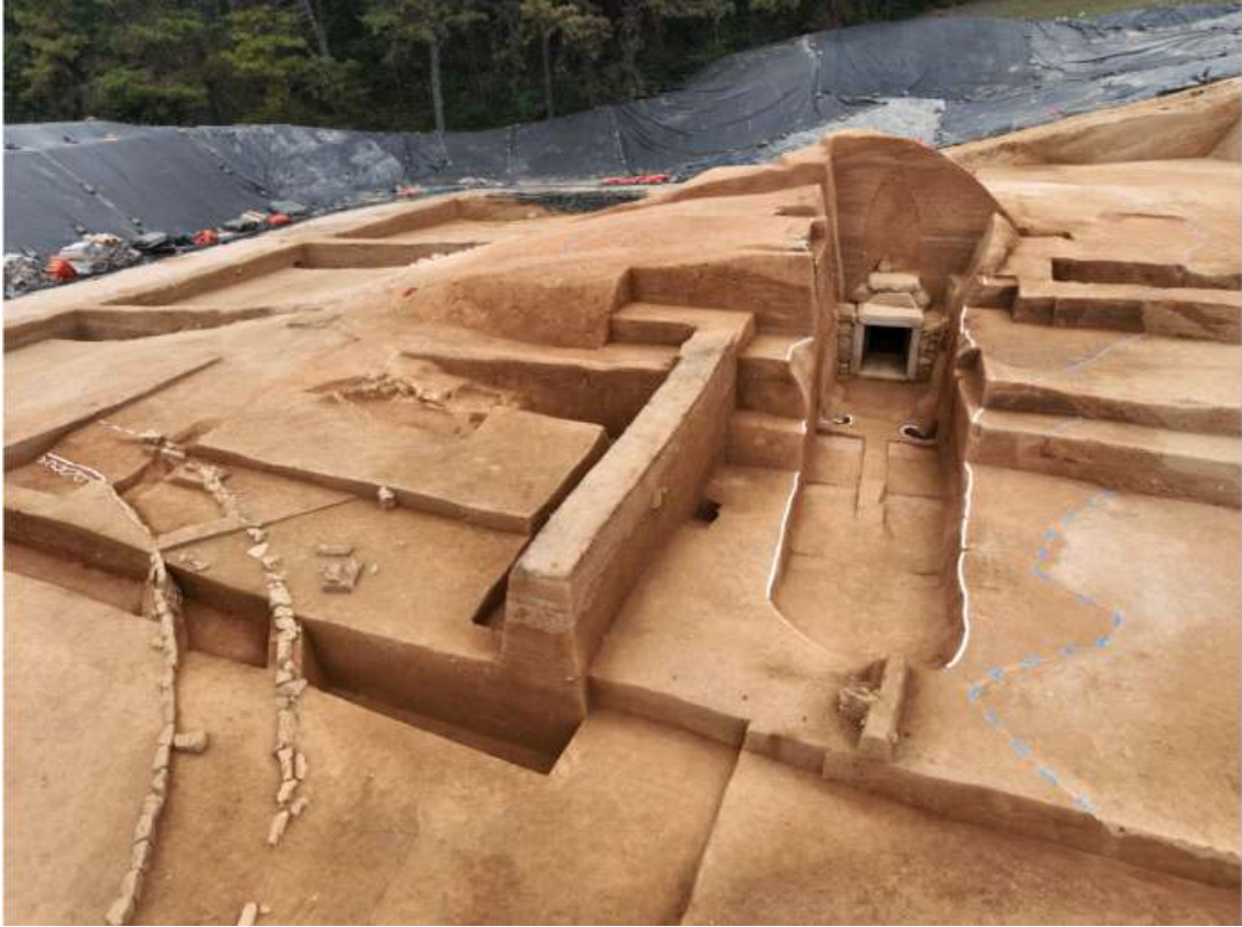
<그림 7. 부여 왕릉원 4호분 발굴조사 후 전경>