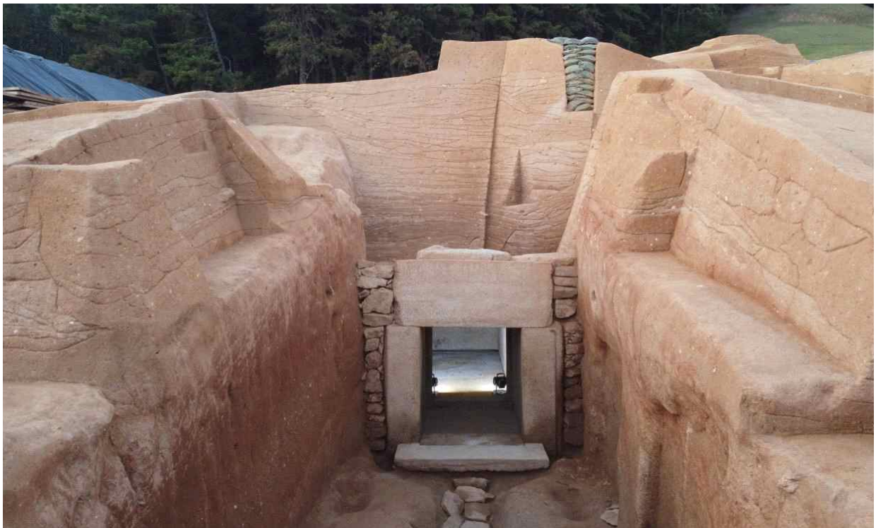
<그림 8. 부여 왕릉원 3호분 돌방과 봉분의 층위>