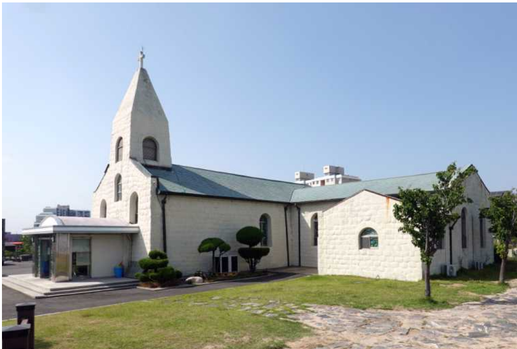
<속초 동명동 성당 전경>