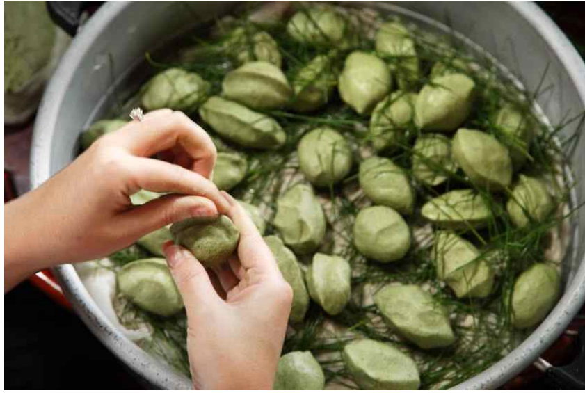
<추석 송편 빚기(충남 당진 남이홍 종가)>