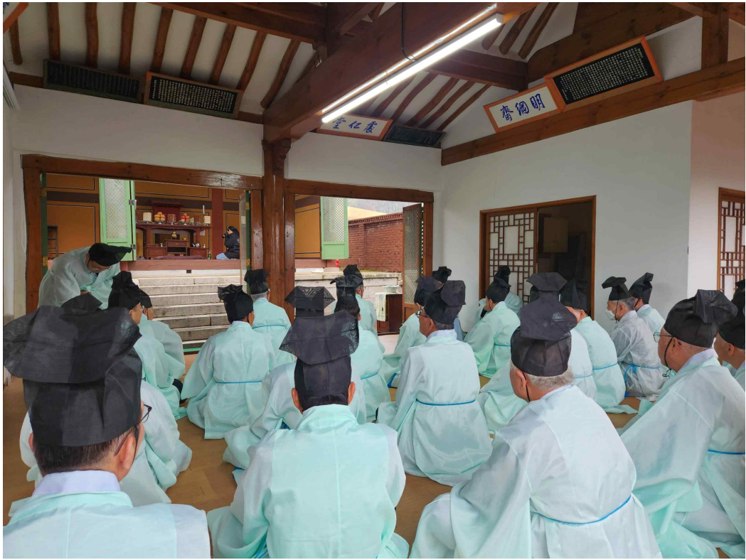
<한식 제사(경기 고양시)>