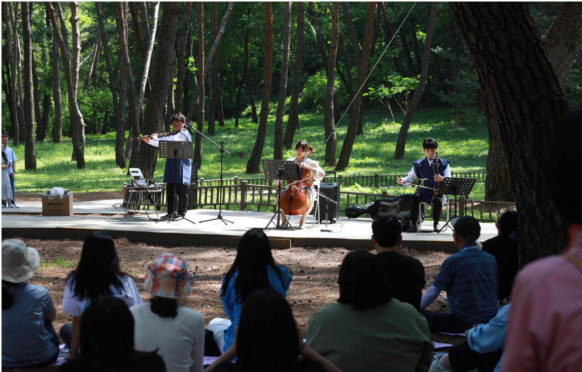
< '단종의 길' 행사 진행 사진('23.5.20.) >