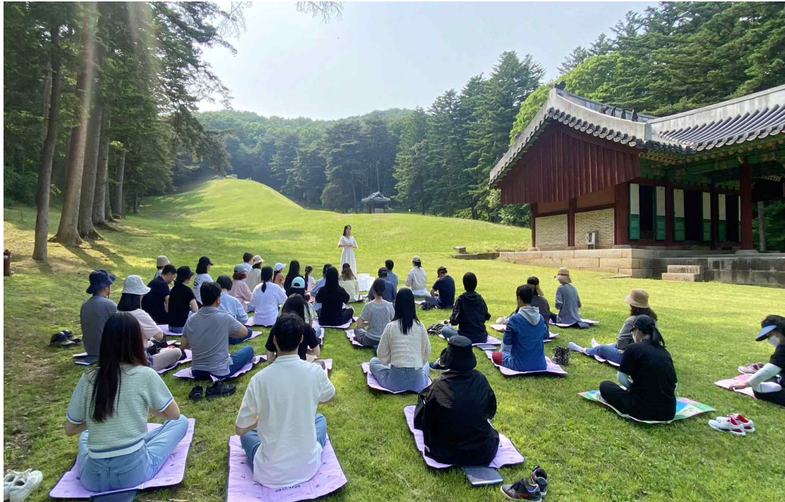
< '숙종의 길' 행사 진행 사진('23.5.15.) >