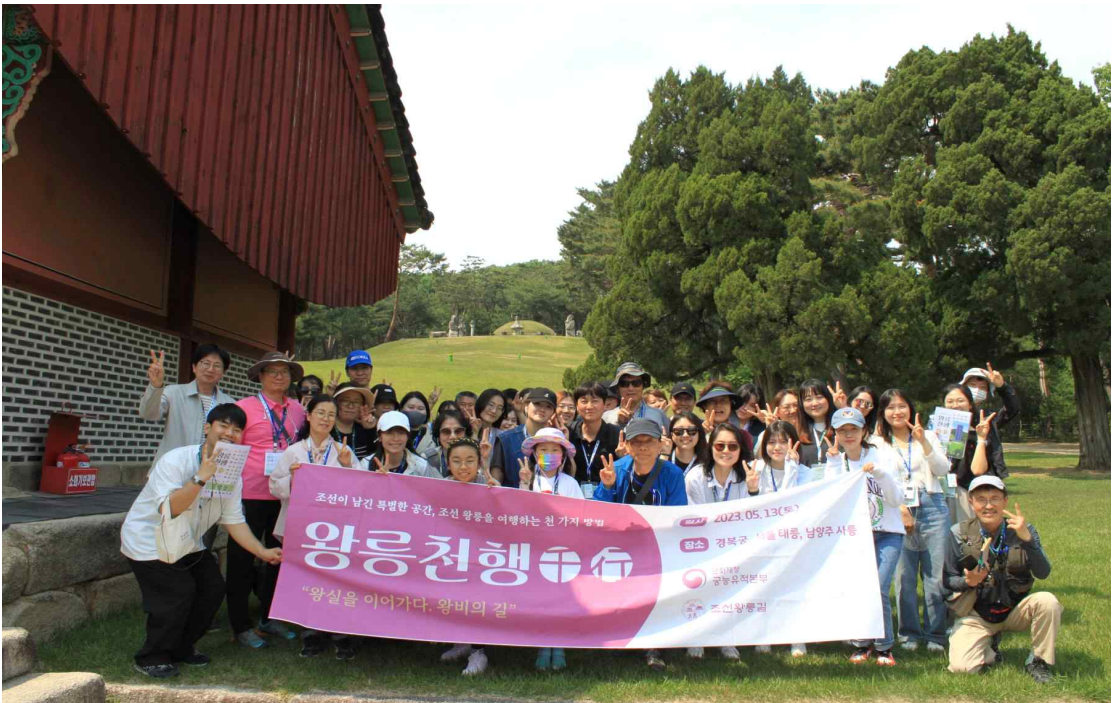
< '왕비의 길' 행사 진행 사진(23.5.13.) >