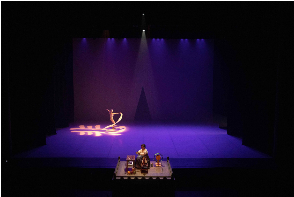
< '생각하는 손' 서울 공연 사진(2023) - 매듭장 >