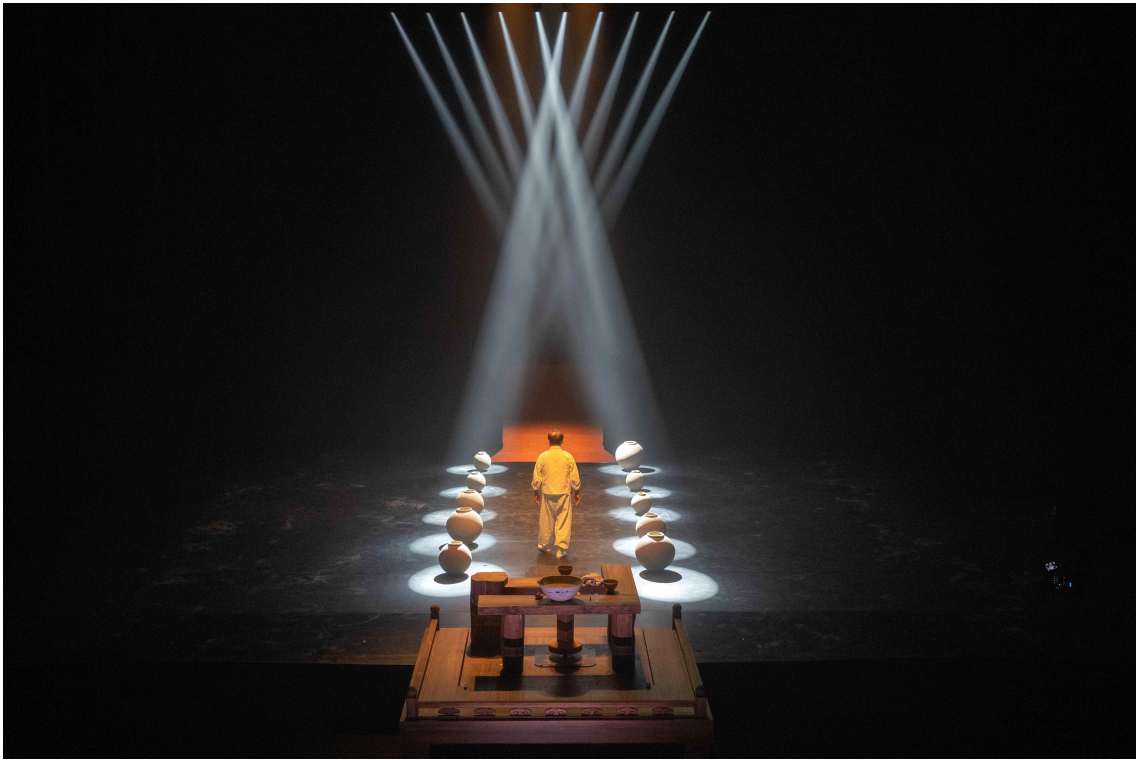
< '생각하는 손' 서울 공연 사진(2023) - 사기장 >