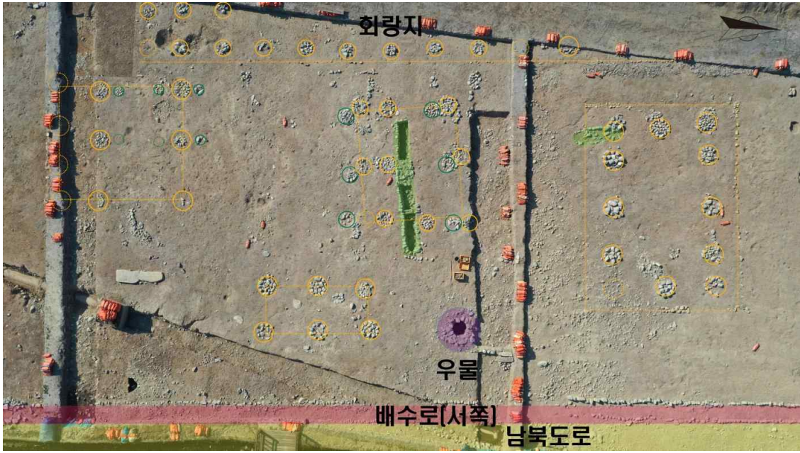
그림 5. 남북대로 서쪽 회랑 건물의 적심석