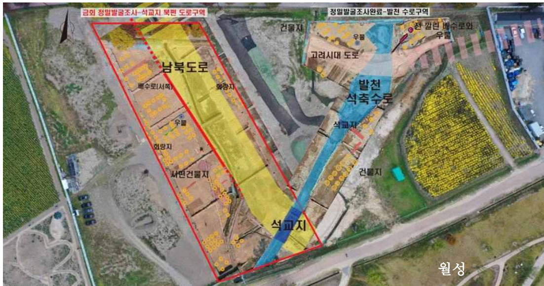
그림 2. 발천권역 발굴조사 범위 및 성과