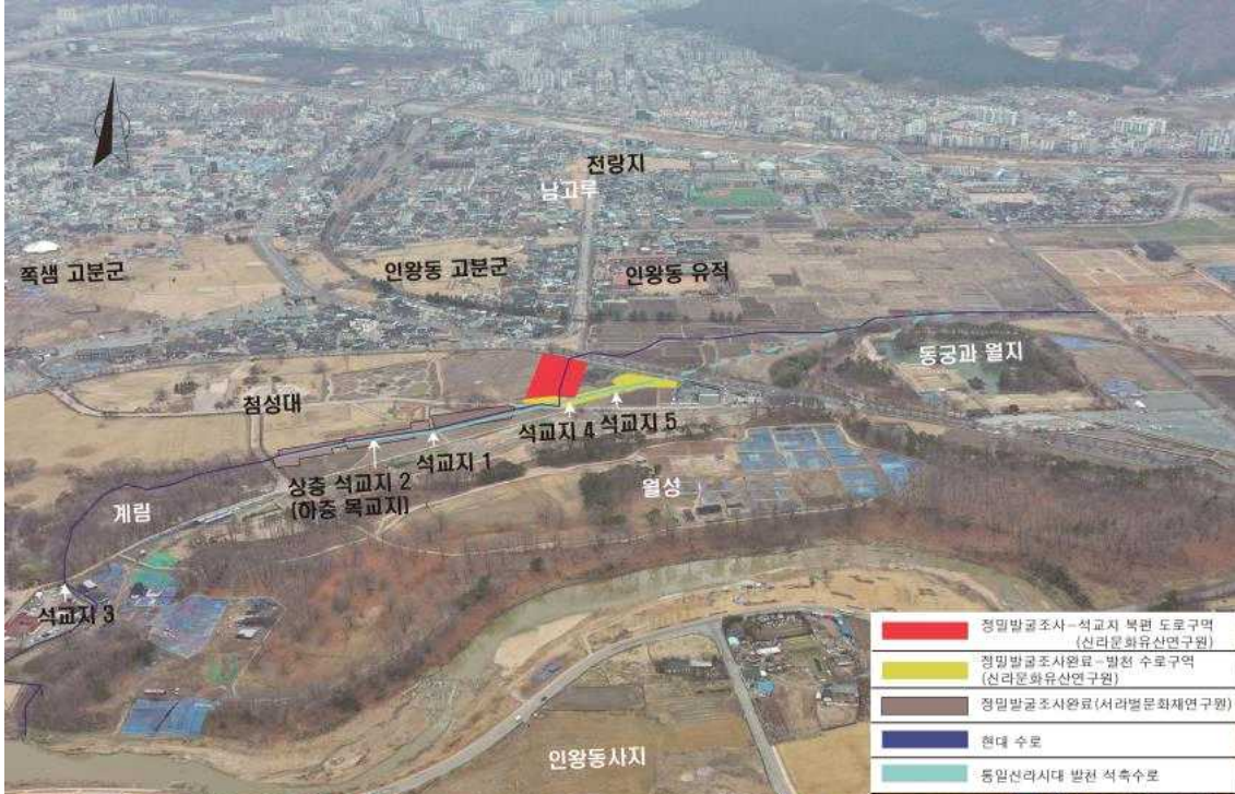
그림 1. 발굴조사구역 원경과 주변 유적지