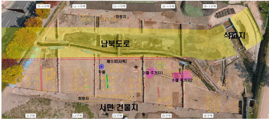
그림 3. 석교지 북편 도로조사 유구현황