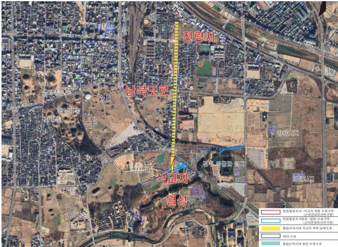
그림 6. 발천 남북대로 전개방향 예상축 (남→북)