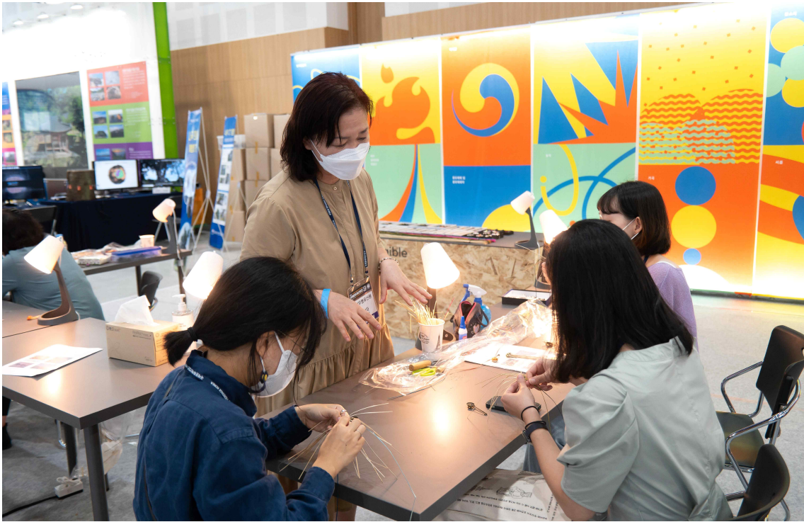
< 완초장(2021) 체험 참고사진 >