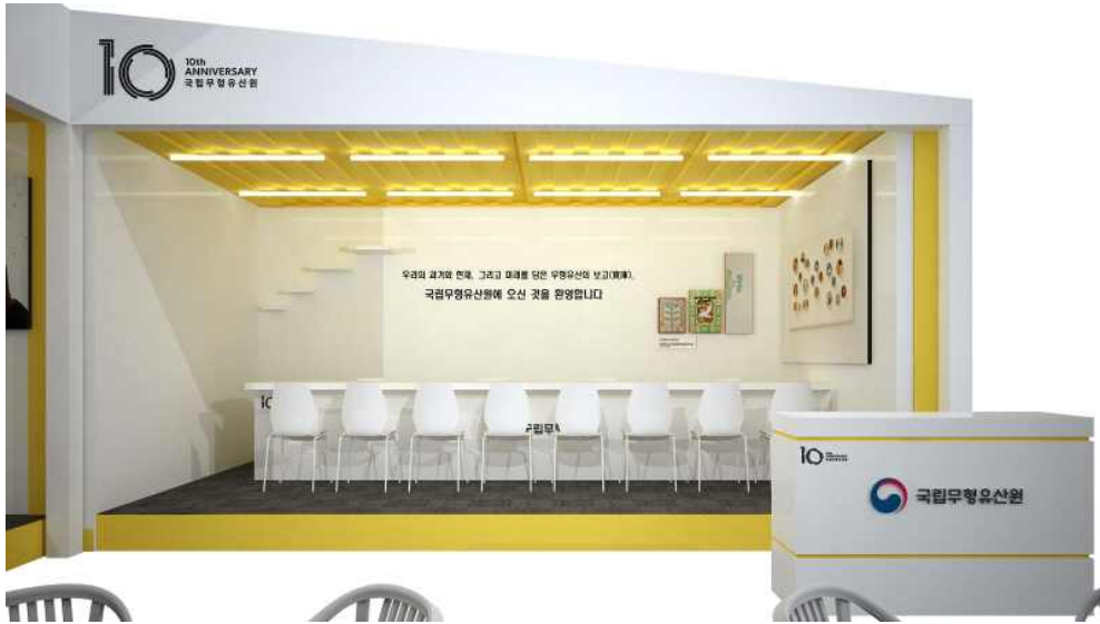
<전시 체험 부스 예상도>