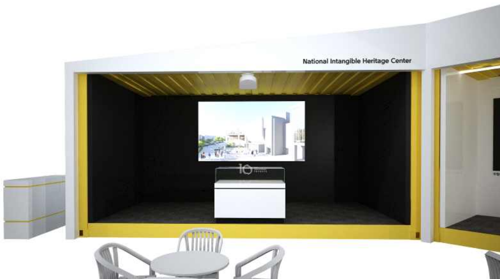
<분원 건립 홍보 부스 투시도>