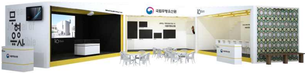
<홍보 체험 부스 투시도>