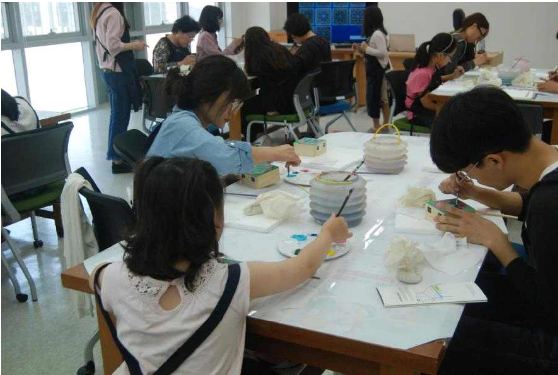
< 단청장 체험(2016) 참고사진 >