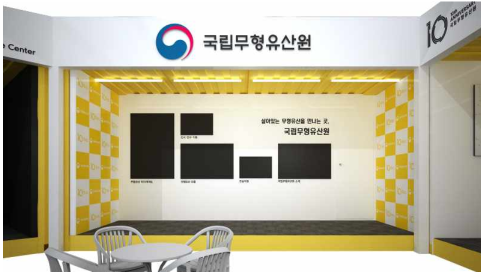
<기관 홍보 부스 예상도>