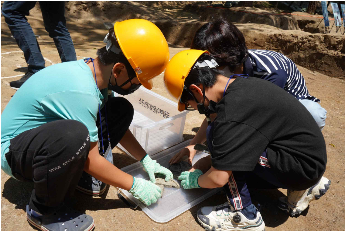
< '나도 고고학자 -백제 사비왕궁유적을 찾아서-' 현장(2022) >