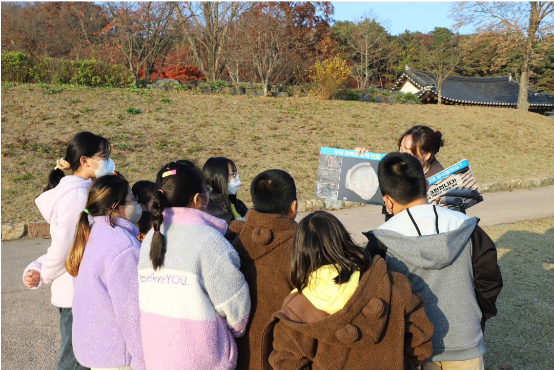
< '상상해봐 사비왕궁유적' 시범운영 현장(2022) >