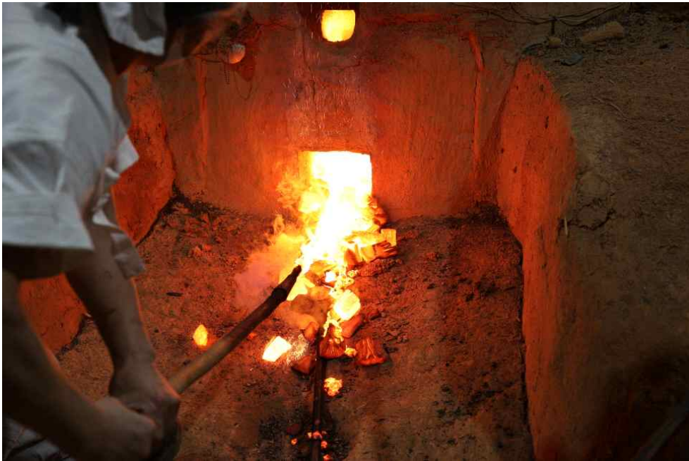
<제철기술 복원실험 사진>