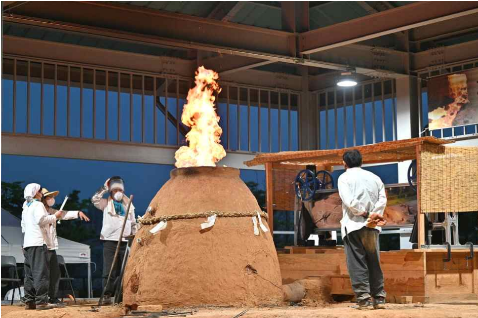
<제철기술 복원실험 사진>