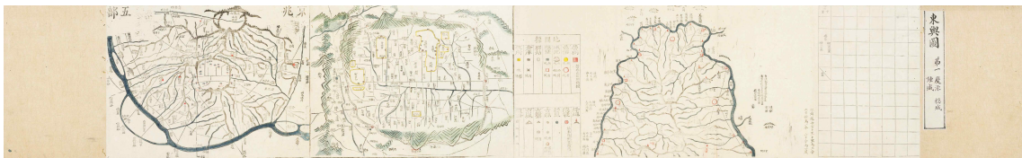
사진 4. 대동여지도(1첩)