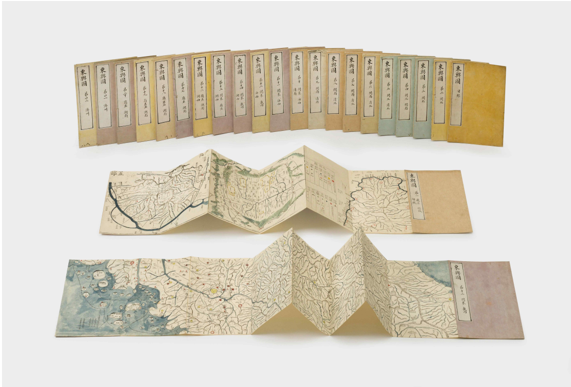
사진 2. 대동여지도(전체 23첩)