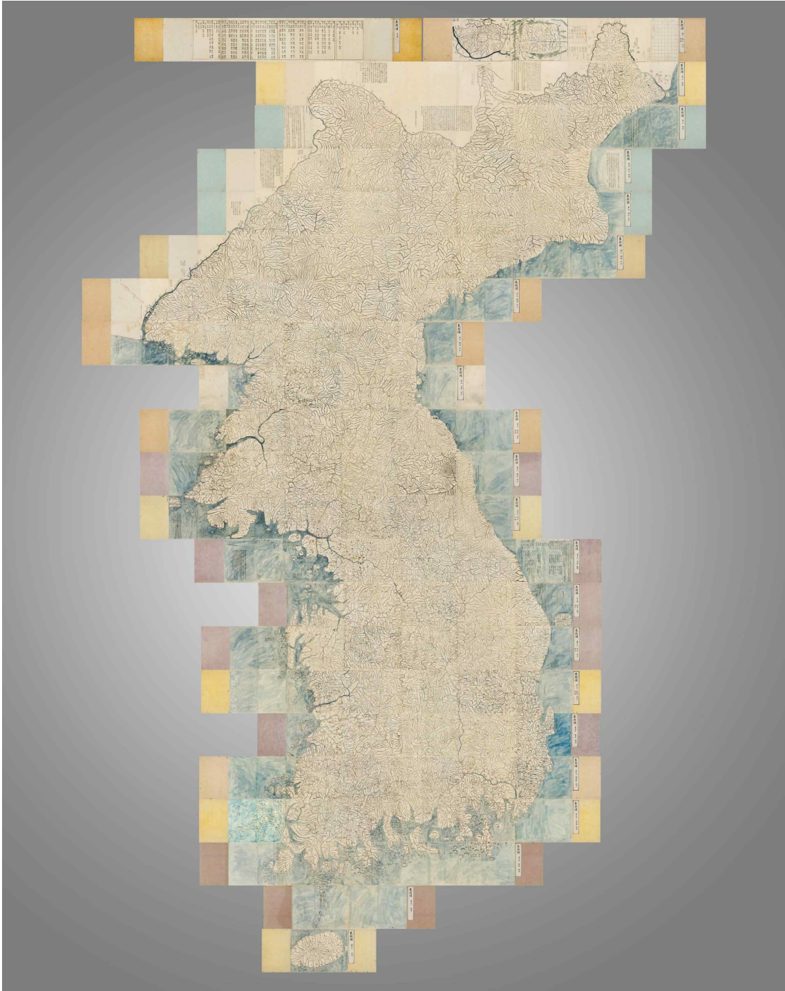
사진 1. 대동여지도(전체 펼친 모습)