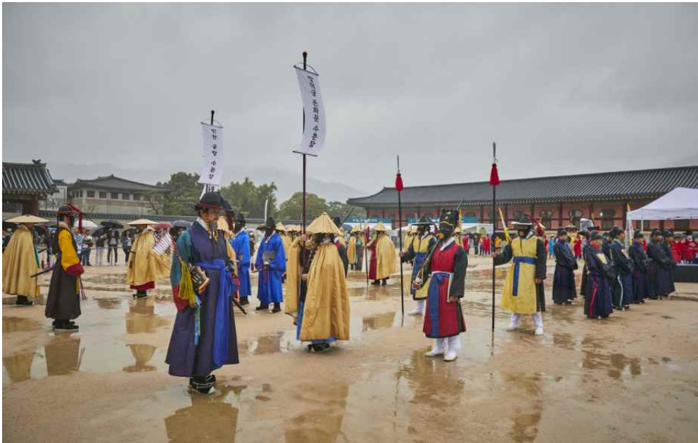
2022년 수문장 임명식 진행 중인 모습(문물관리 및 수문장 입장 후)