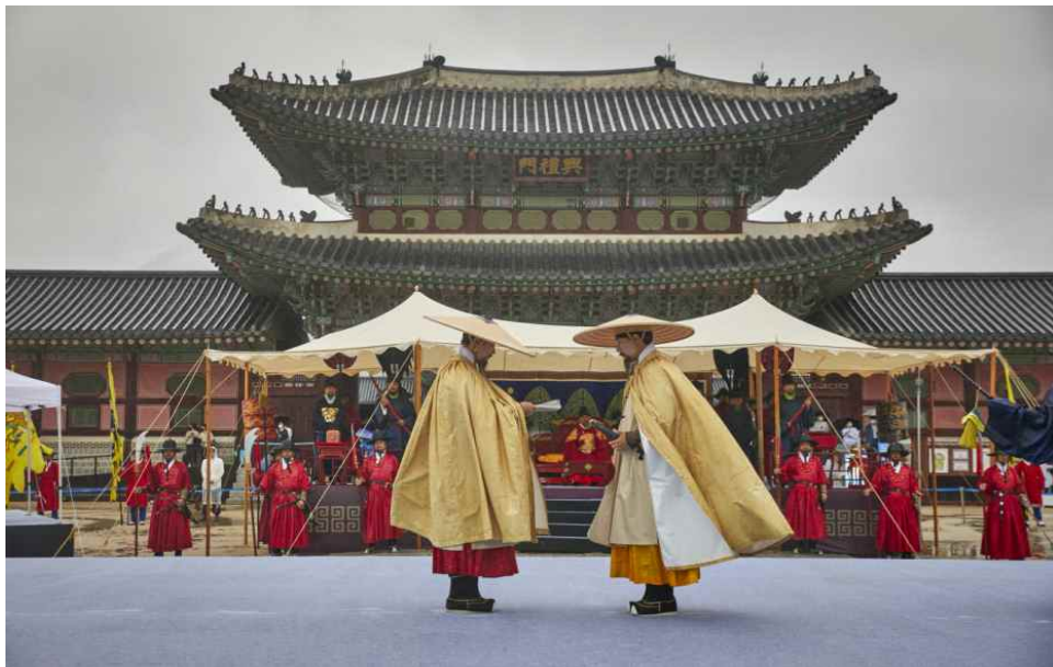
2022년 수문장 임명 절차 진행 중인 모습