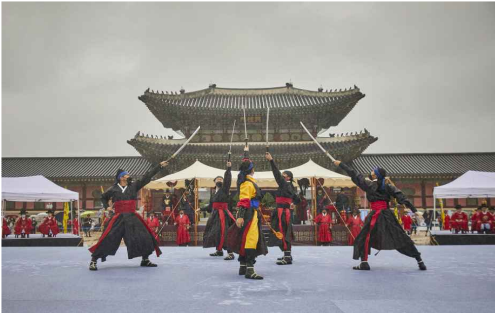
제주목 관아의 연무 시연(특별공연)