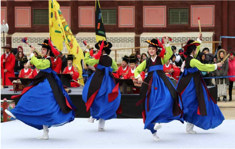
한국의집 예술단 '검무' 시연(특별공연)