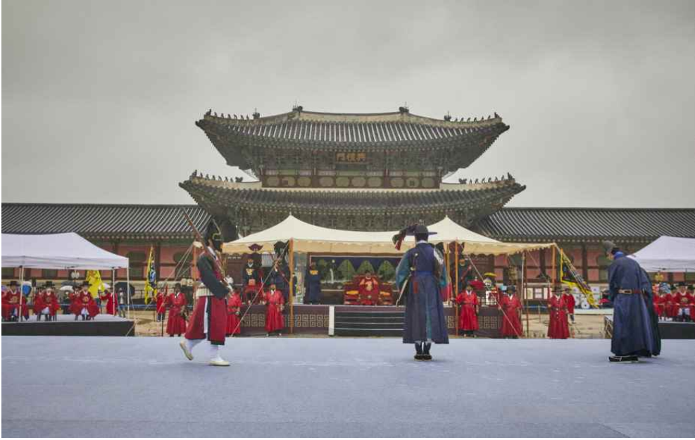
2022년 수문장 임명 절차 진행 중인 모습(돈화문 수문장)