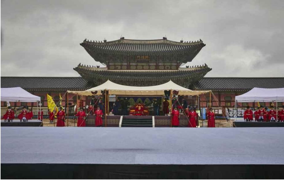
2022년 수문장 임명식 진행 사진