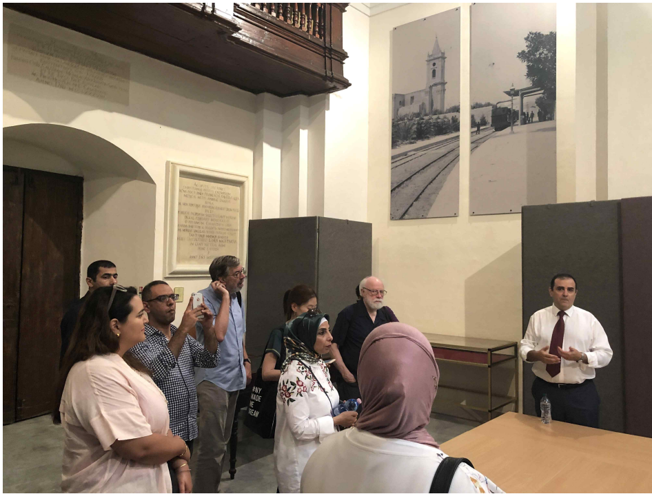
< '2019 협력국 유네스코 세계기록유산 역량강화 워크숍' 현장사진 >