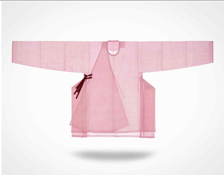
<이주은 作 - 단령(2021) 모시, 명주 | 총장 122cm, 화장 128cm, 품 74cm>