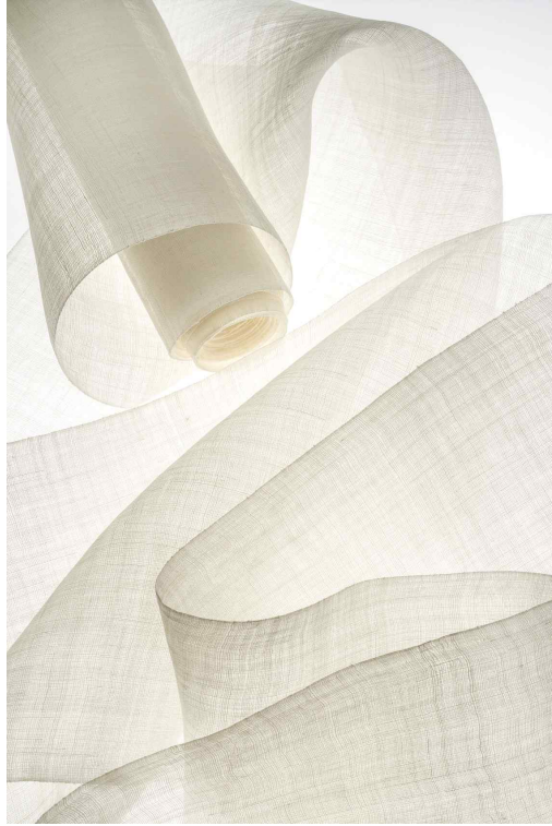
<최유진 作 - 백모시(2021) 모시 | 길이 1000cm, 폭 36cm>