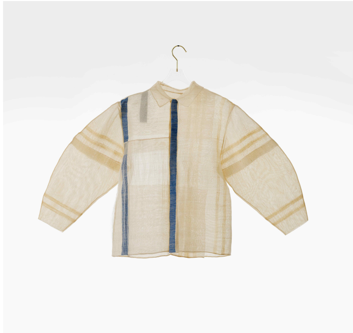
<오유경 스튜디오(현대복 구성) · 김지후(모시 응용 직물) 作 - 날실 디테일의 등근 배래셔츠(2022)>