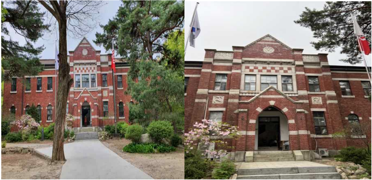
서울 천도교 중앙총부 본관(정면)