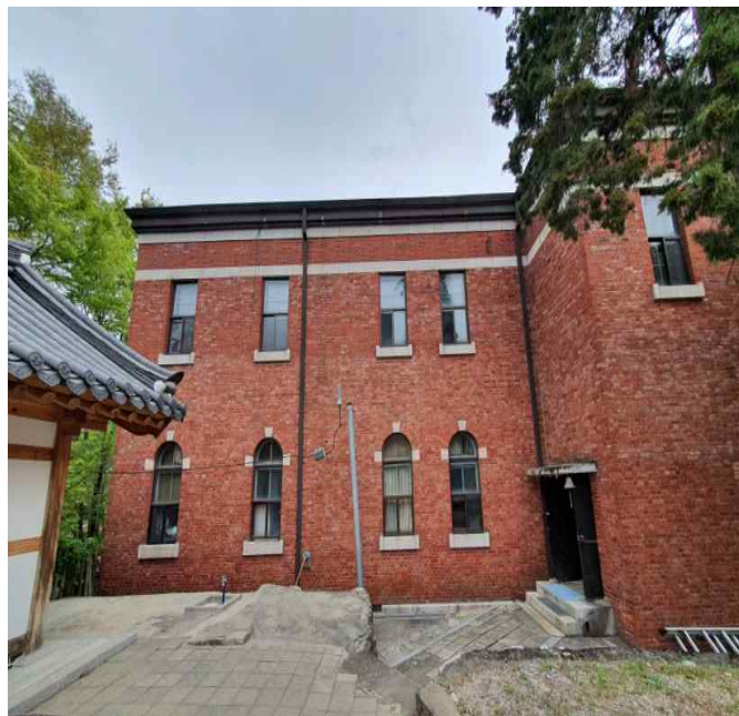
서울 천도교 중앙총부 본관(배면)