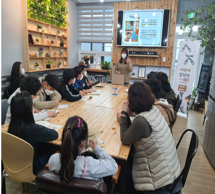
< 2020 세종 어린이 집현전 교육 현장 사진 >