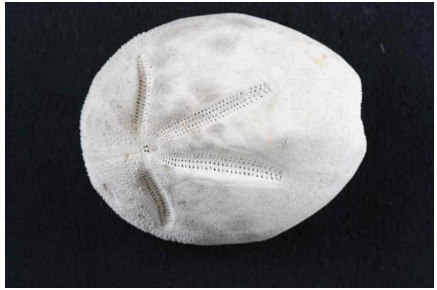
성게류 화석 (제주민속자연사박물관)