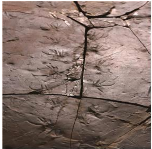
도마뱀발자국 화석 (진주익룡발자국전시관)