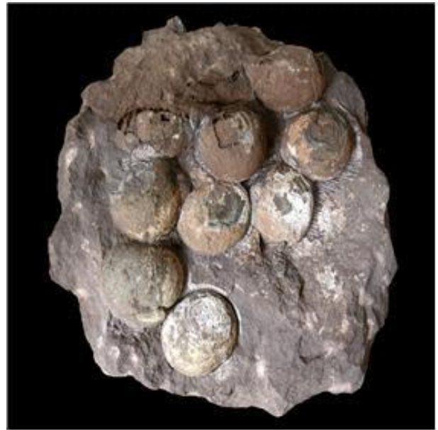
공룡알둥지 화석 (서대문자연사박물관)