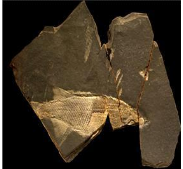
물고기 화석