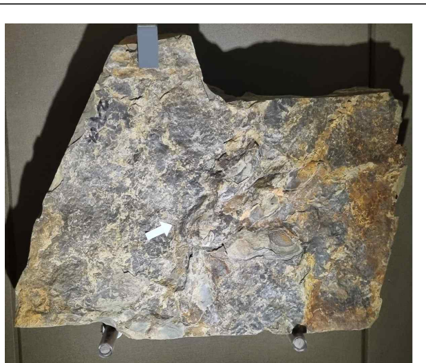
수각류공룡발자국 화석 (부산해양자연사박물관)