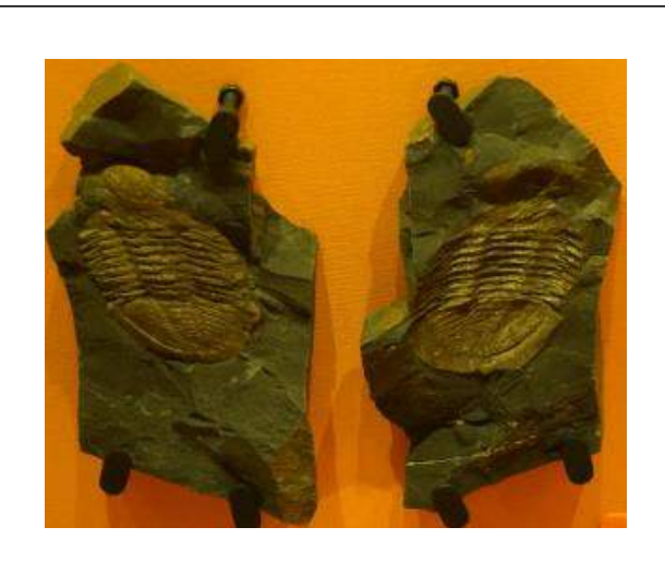
삼엽충 화석 (강화자연사박물관)