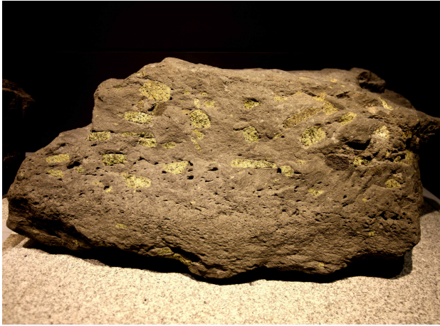
감람암포획 현무암 (한국지질자원연구원)