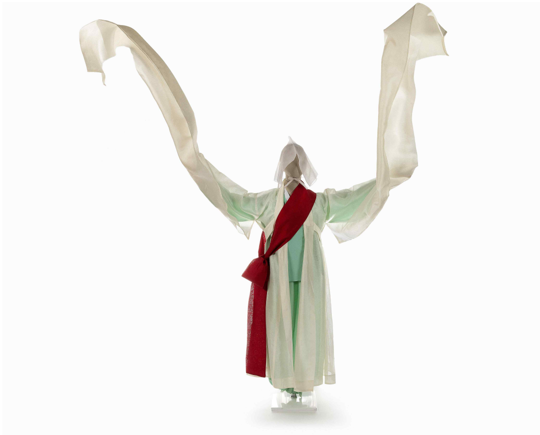
<고(故) 임이조 전승교육사가 실제 착용한 승무 복식>