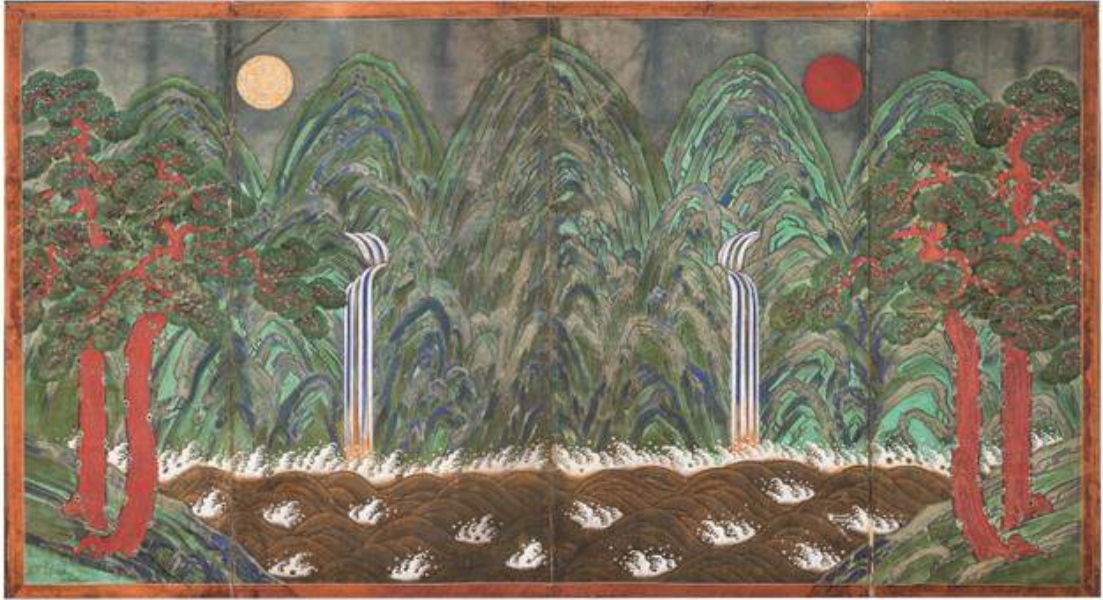
<창덕궁 인정전 일월오봉도 처리 전>