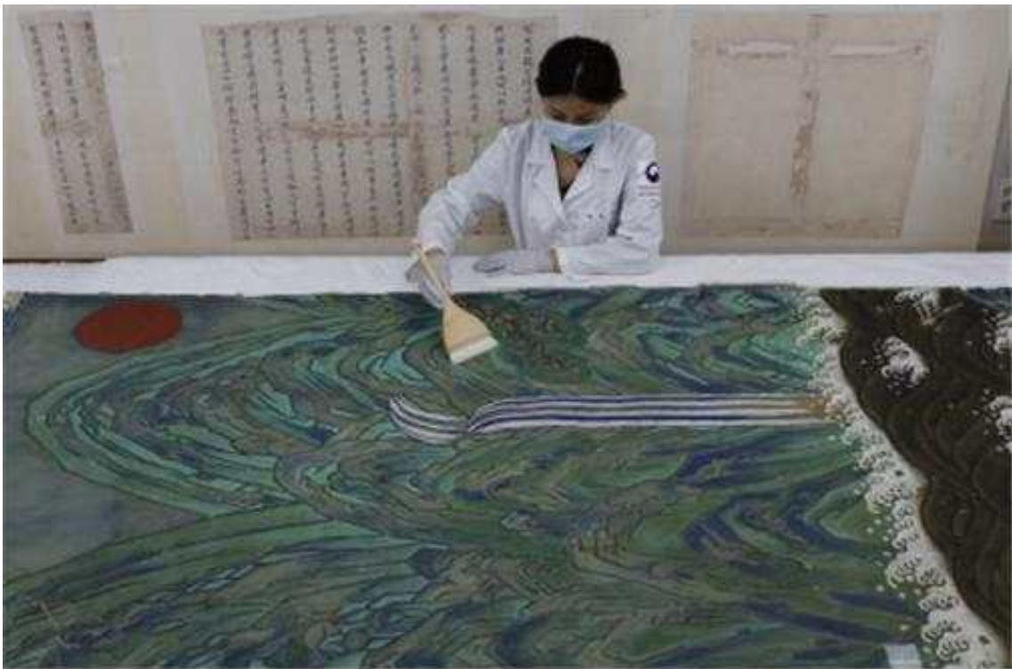
<화면 건식 세척>