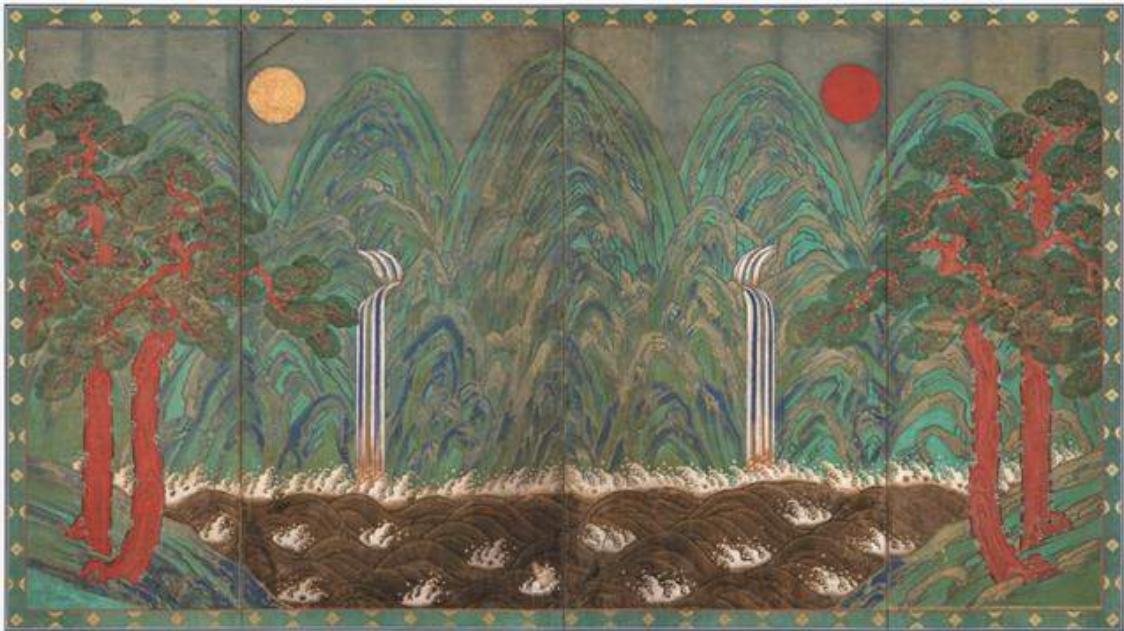
<창덕궁 인정전 일월오봉도 처리 후>