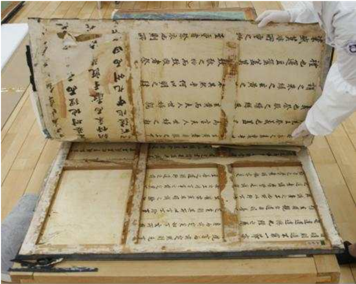
<화면 해체 - 병풍틀 배접 시권>