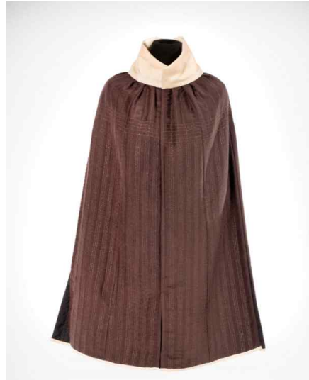
<덧요 - 김소연(누비장)>