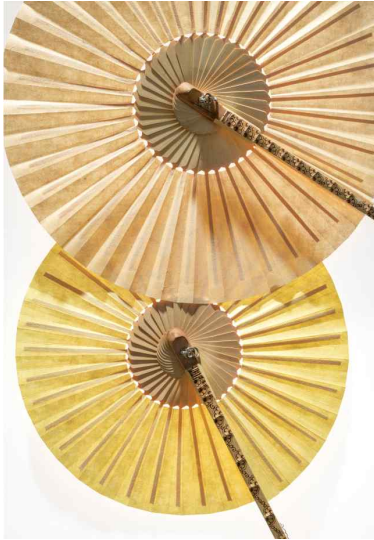
<륜, 그들의 크기 - 김대성(선자장)>