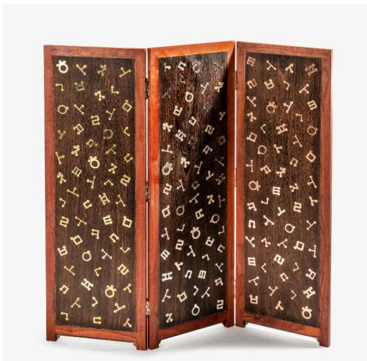
<어깨동무 - 김진환(두석장)>