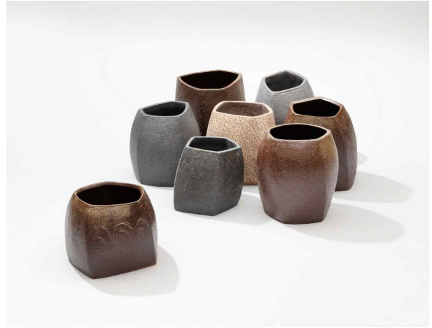
<모난 용기 - 정영락(용기장)>