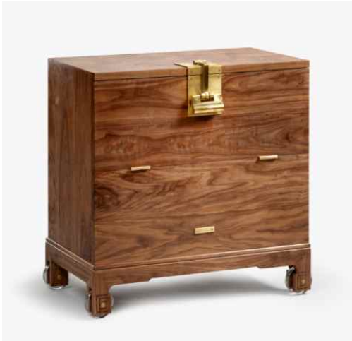
<바퀴 달린 반닫이 - 방석호(소목장)>