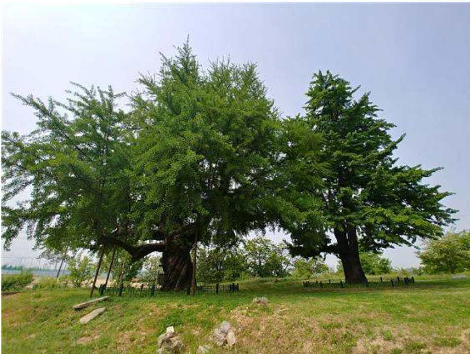
<세종시 세종리 은행나무>