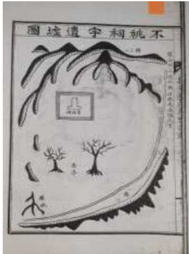
<부안임씨 세덕록(世德錄)목판도 (1962년 간행된 증보(增補))>