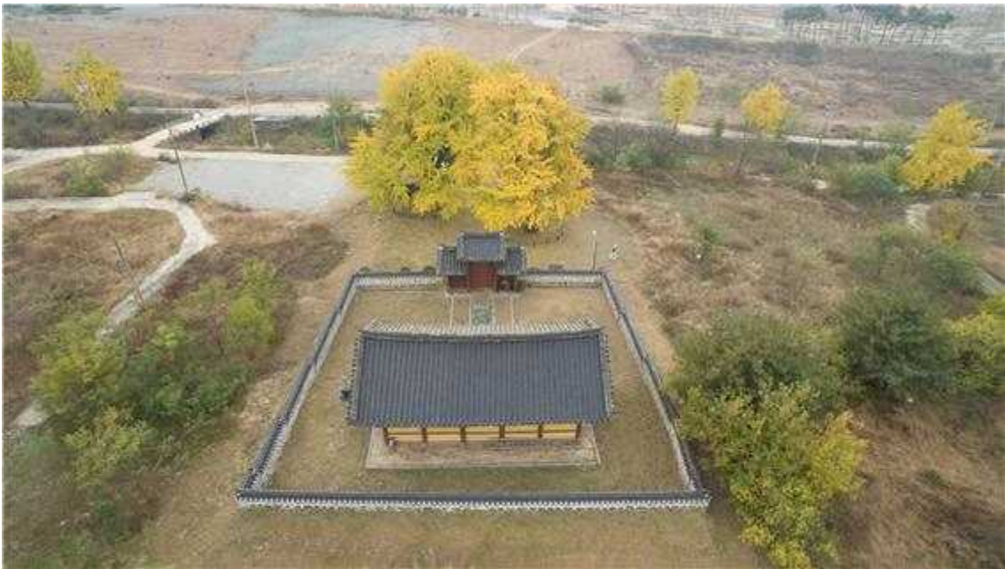
<세종시 세종리 은행나무와 송모각>