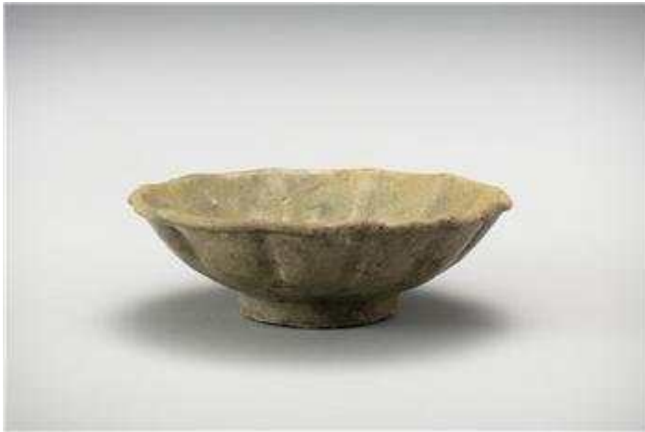
<청자화형접시(보존처리 후) 전남 영광군 낙월도 해역 발굴>