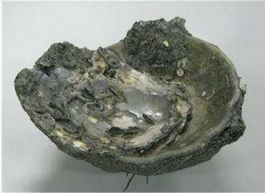
<청자화형접시(보존처리 전) 전남 영광군 낙월도 해역 발굴>