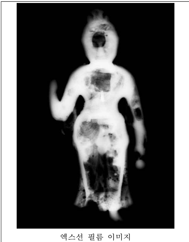
엑스선 필름 이미지