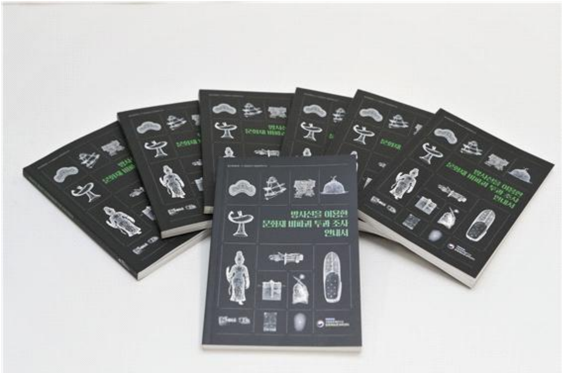
<『방사선을 이용한 문화재 비파괴 투과 조사 안내서』>