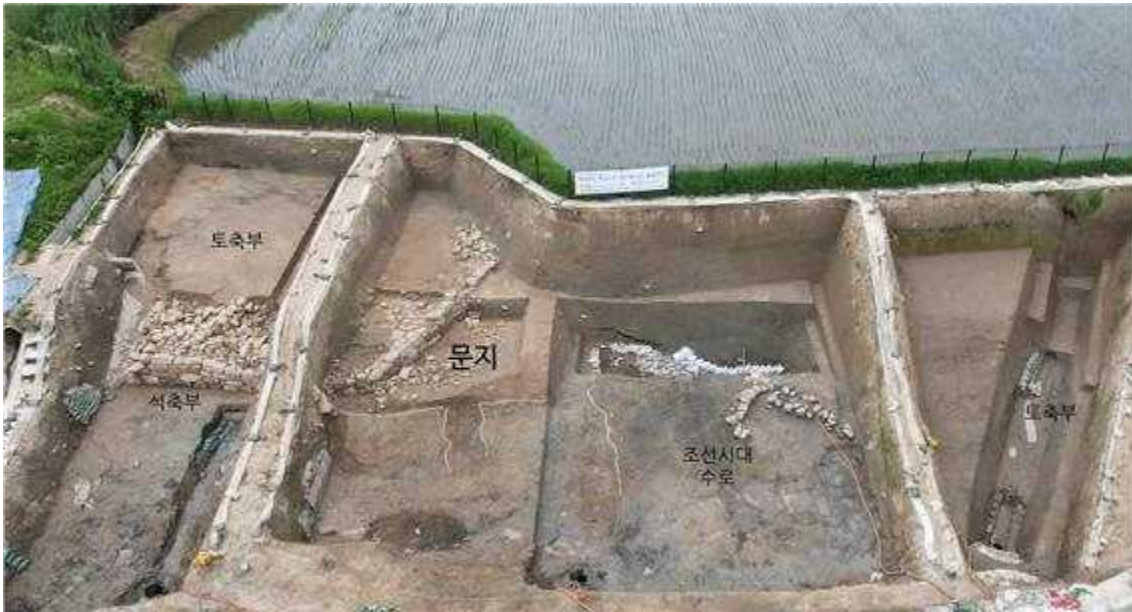
<부여 나성 북문지 전경>