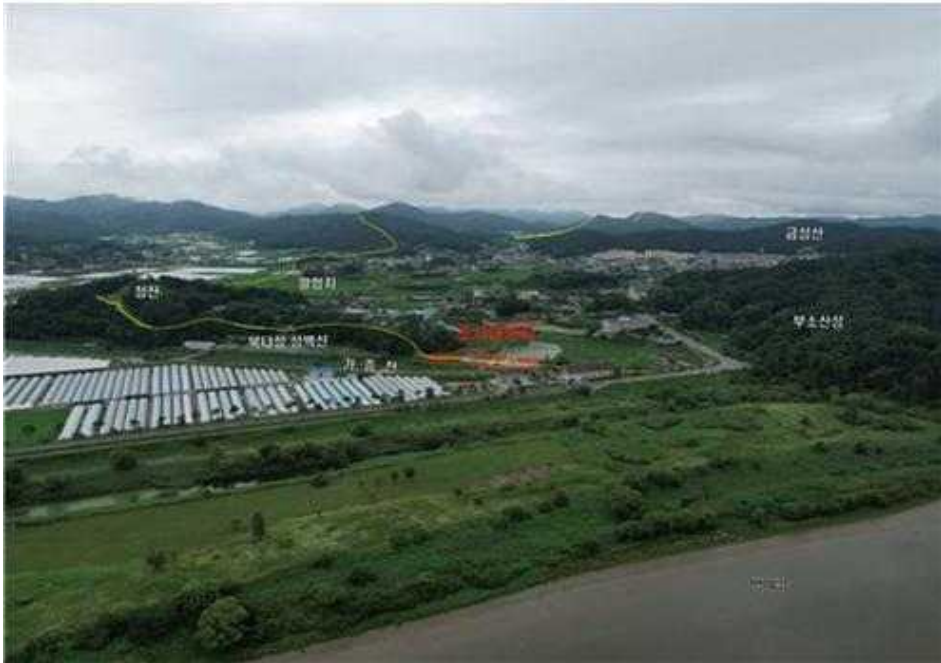
<백마강(북쪽)에서 바라본 조사대상지 전경>