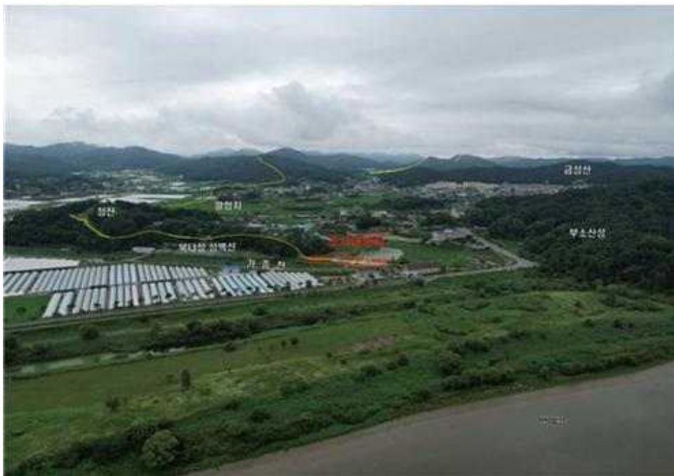
<청산(동북쪽)에서 바라본 조사대상지 전경>