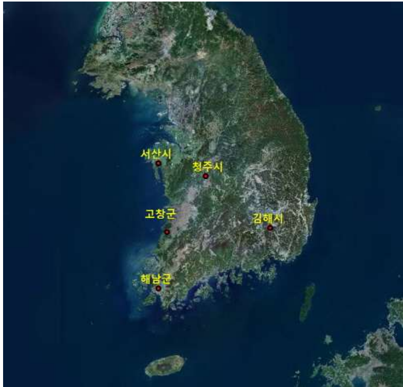
<황새 서식지 참여 5개 지자체>