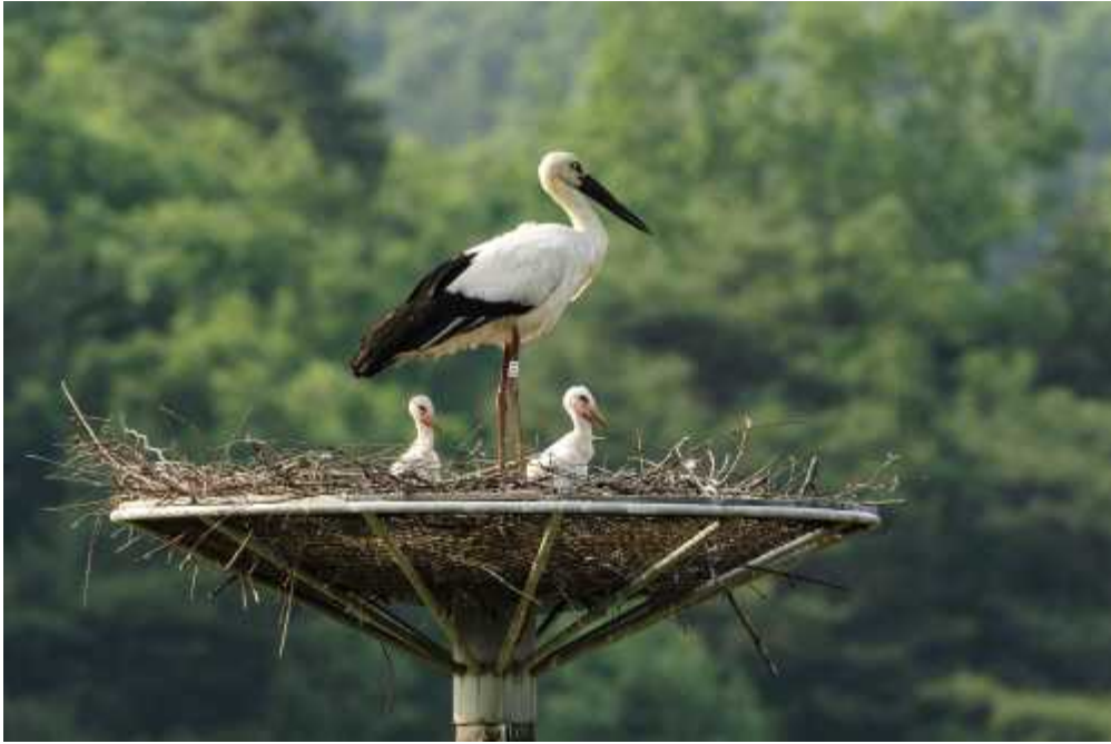
<황새 부부와 아기 황새>