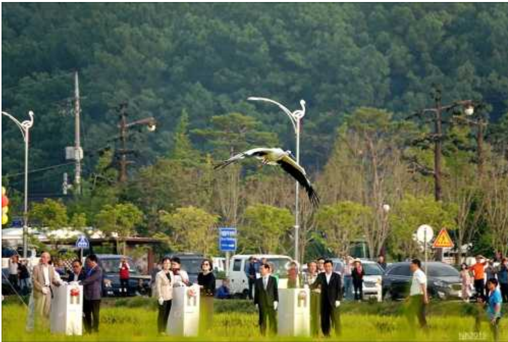
<2019년 9월 28일 예산황새축제 자연복귀행사 현장>