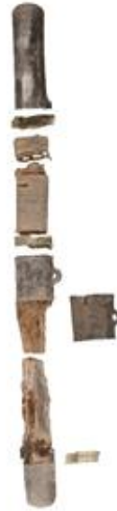
1호분 출토 작은 장식칼