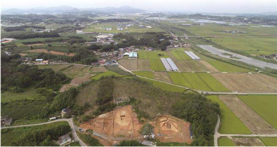
<나주 송제리 고분군 전경>