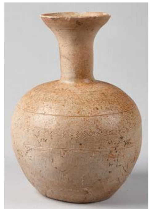
3호분 출토 장경병