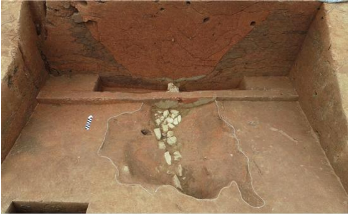
<2호분 남측에서 확인된 배수로 유구>