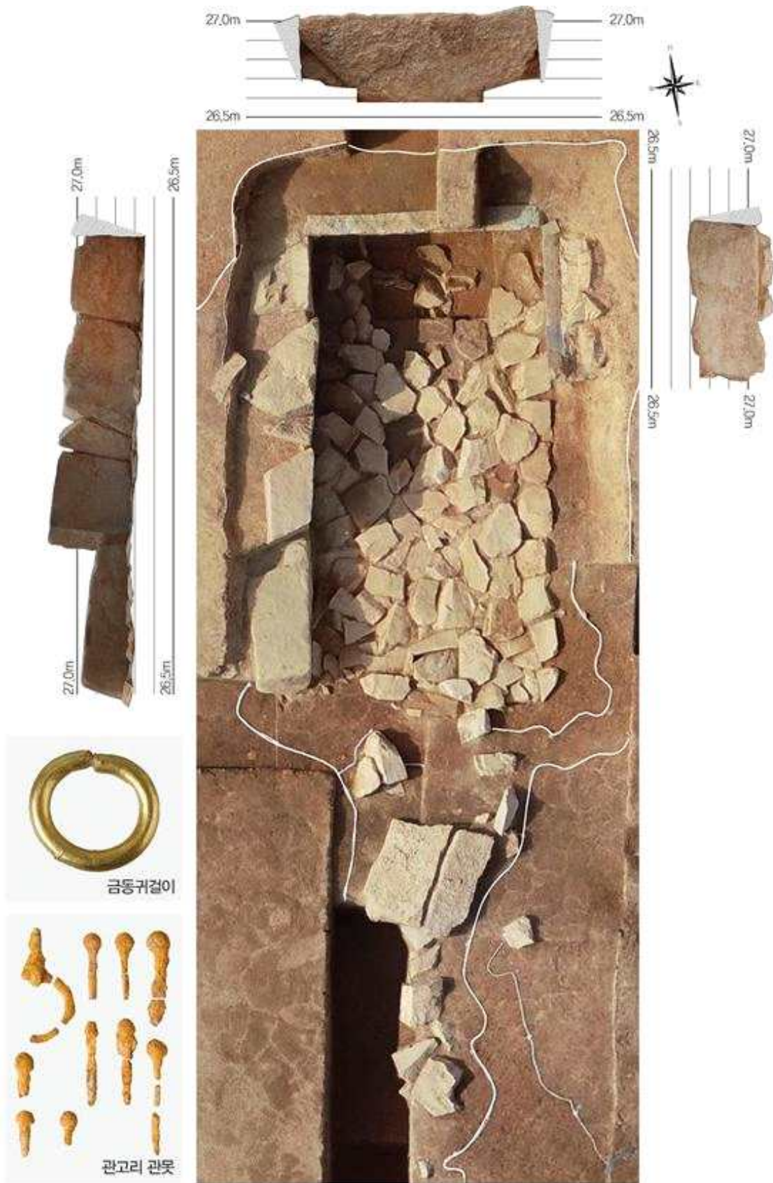
<4호분 매장시설 전개도와 출토유물>