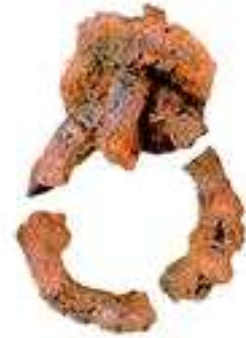
3호분 출토 관고리