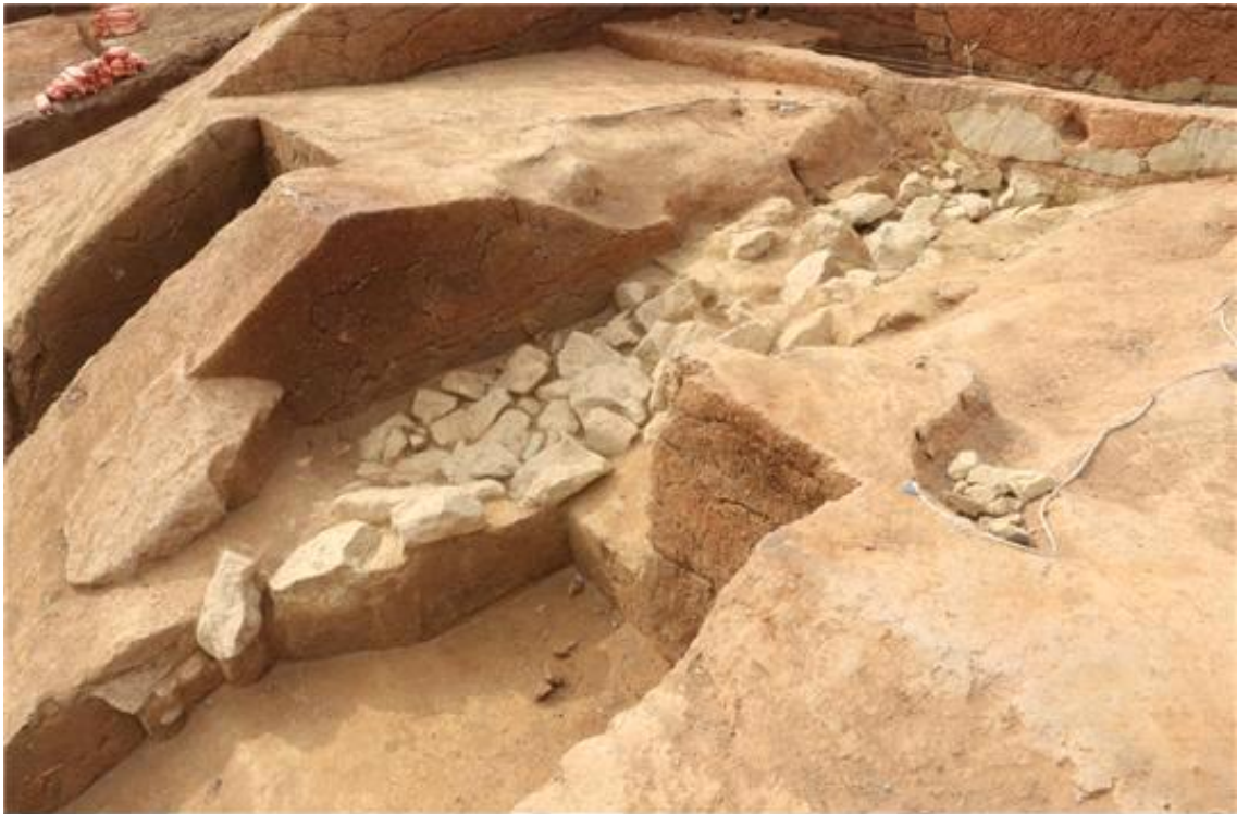
<2호분 남측 배수로 유구 조사 완료 후>