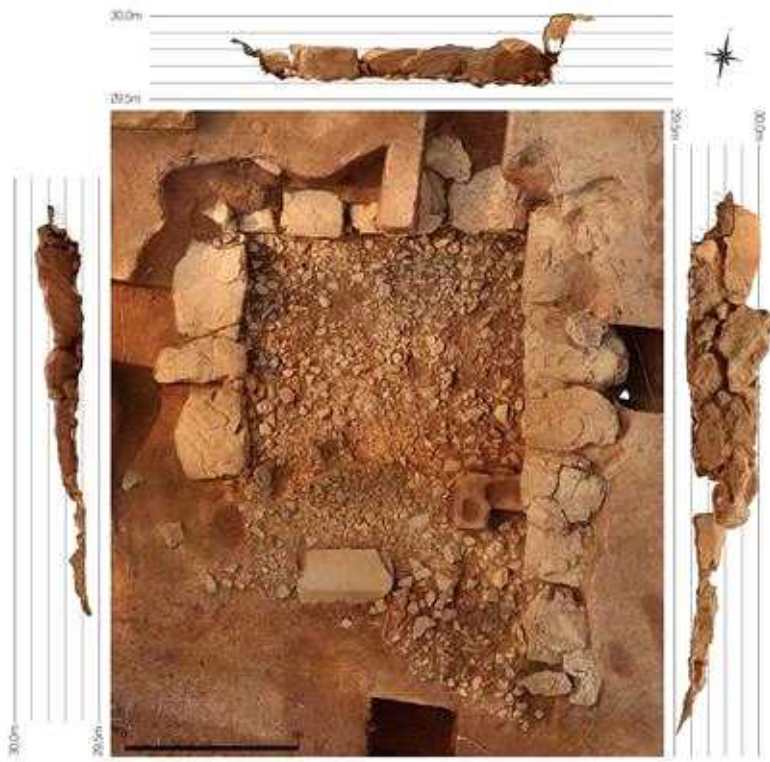
3호분 매장시설 전개도