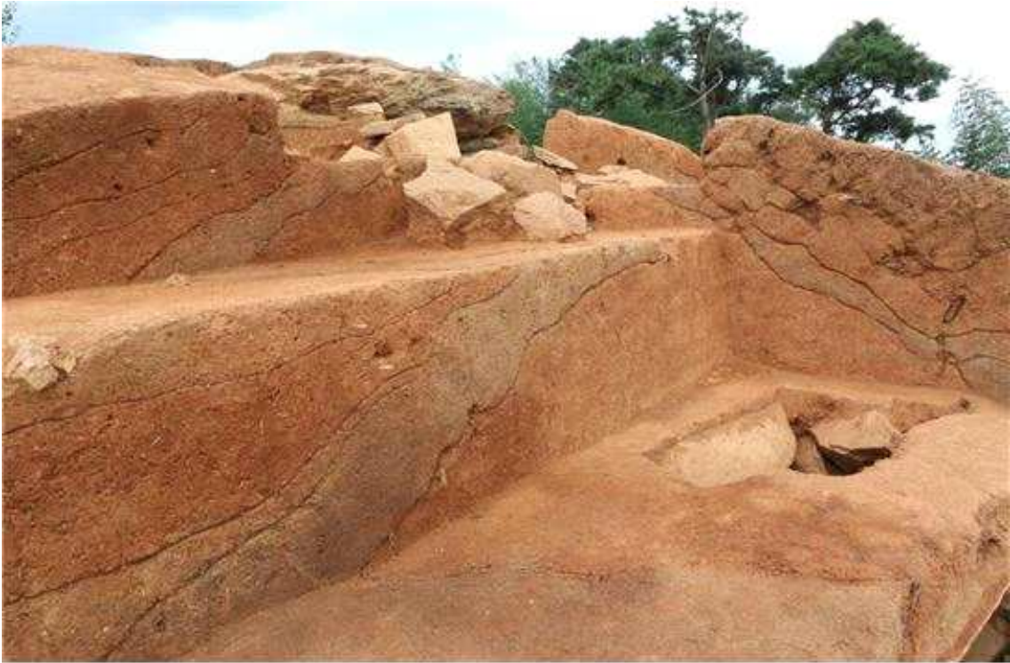
<1호분 출입시설 상부 성토 양상>