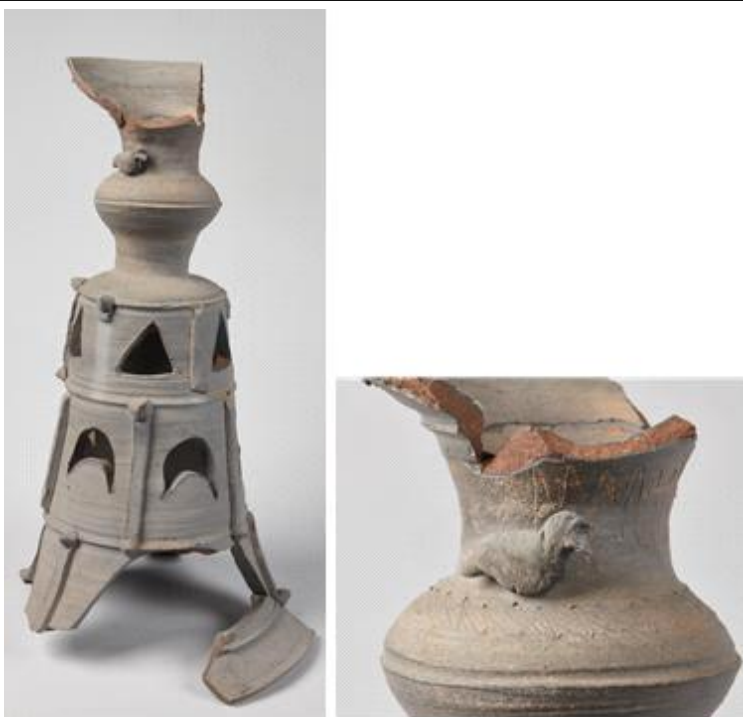
3호분 출토 기대(좌)와 오리장식 세부(우)