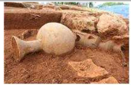
3호분 토기 출토상황