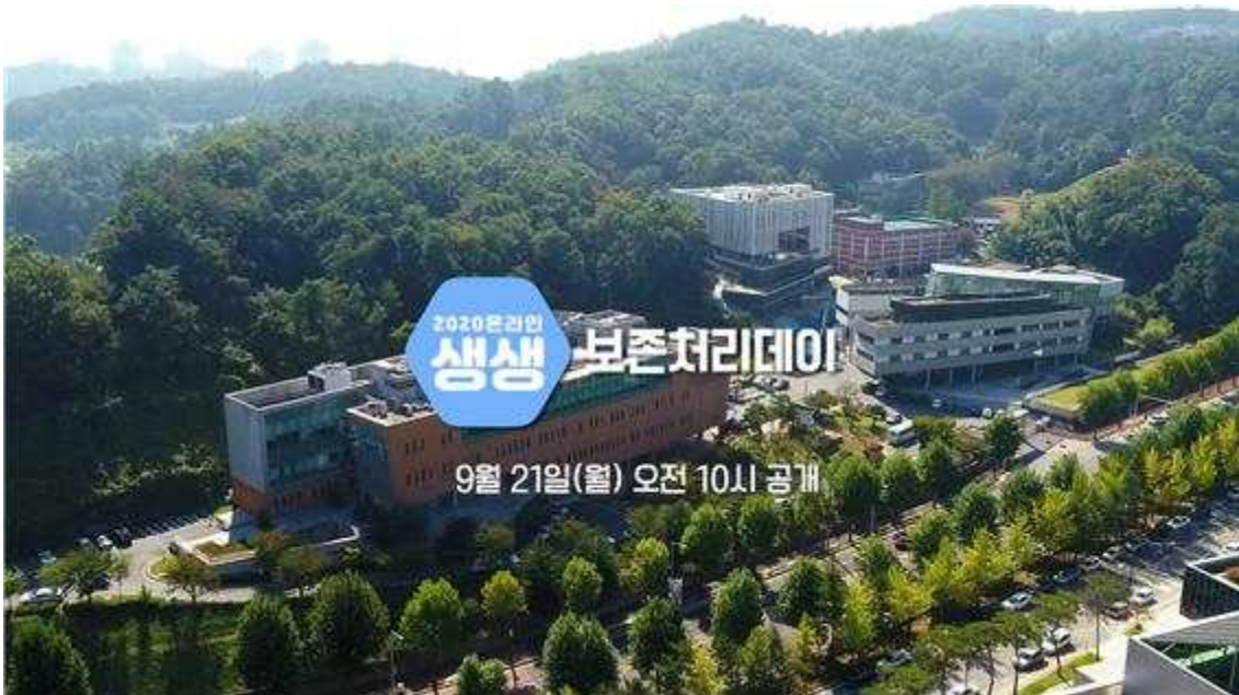
<온라인 3부작 유튜브 영상 화면>