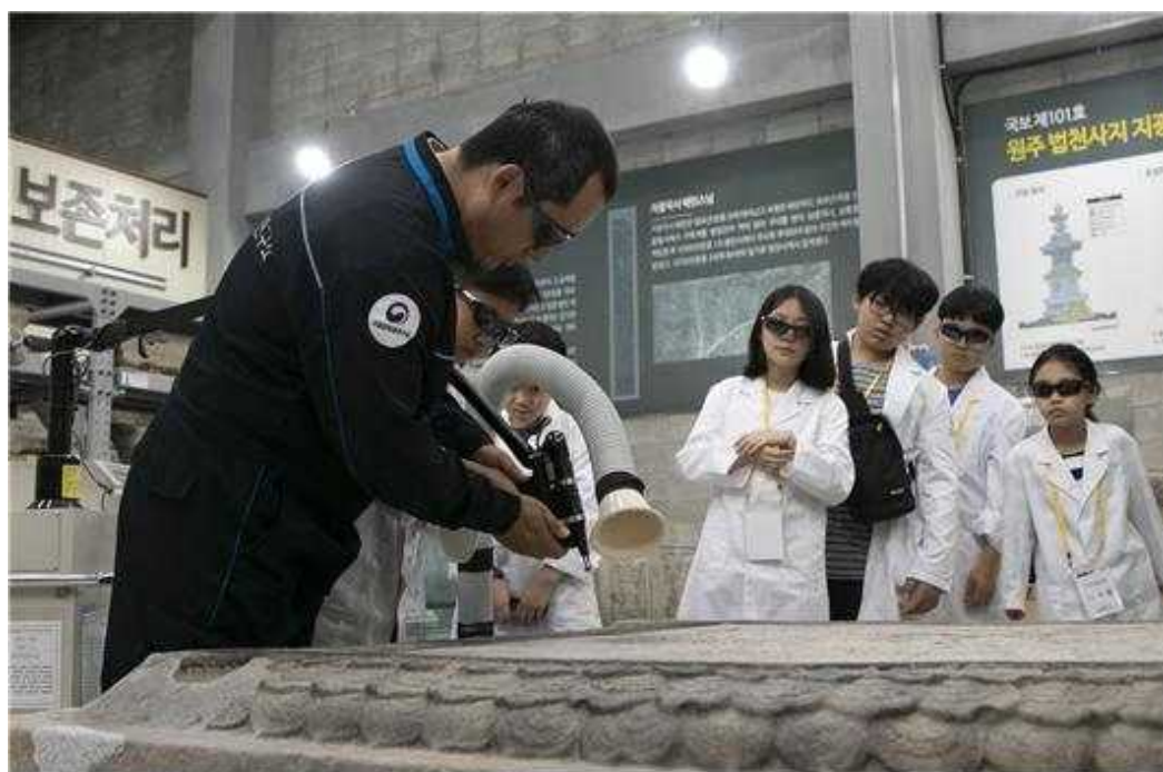
<2019년 생생보존처리데이 현장>