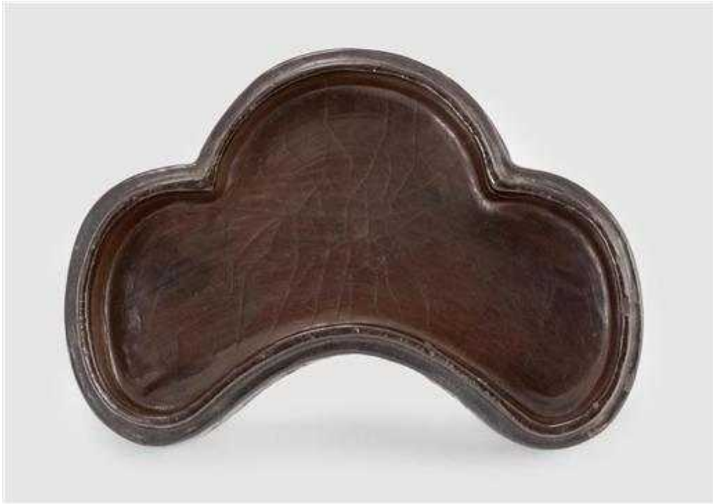
〈나전국화넝쿨무늬합 몸체 바닥면〉