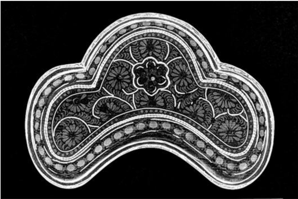
<나전합 뚜껑 상면 X-선 사진