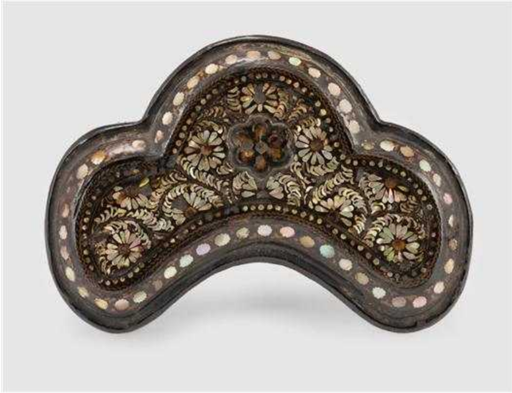
<나전국화녕쿨무늬합 뚜껑 상면>