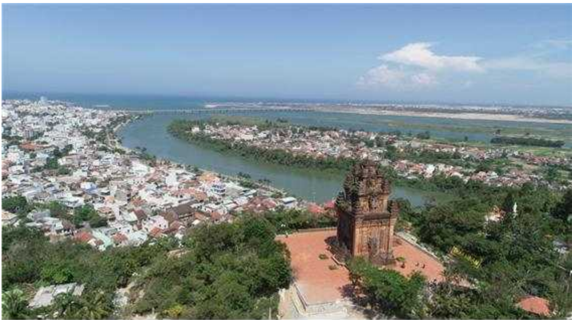
<푸옌(Phú Yên)성(省) 바다랑(Ba-Đà Rằng)강과 난탐(Nhạn Tháp) 무역항>