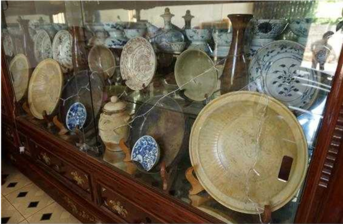
<꽝응아이성(省) 빈쩌우 해역의 민가에서 소장하고 있는 난파선 도자기>