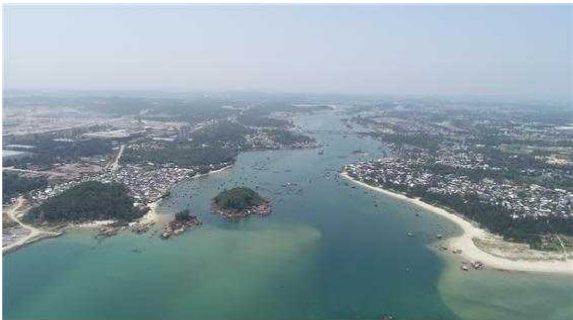
<꽝응아이성(省) 사건(Sa Cầm) 하구 전경>>