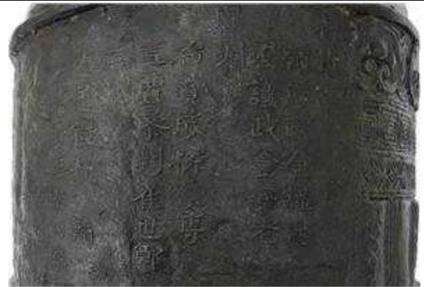
보존처리 전 · 후 명문 상태

都提調 領議政金謹思 老議政金安老 提調 右贊成柳溥 工曹判崔世鄭 都廳 右通禮朴翰 司僕寺正李公楮 司憲府執義安 珍 掌令金遂世 監 掌樂院主簿蔡無敵 天文學教授辛輔商 昭格署參奉姜永世 关父肄習官印光弼