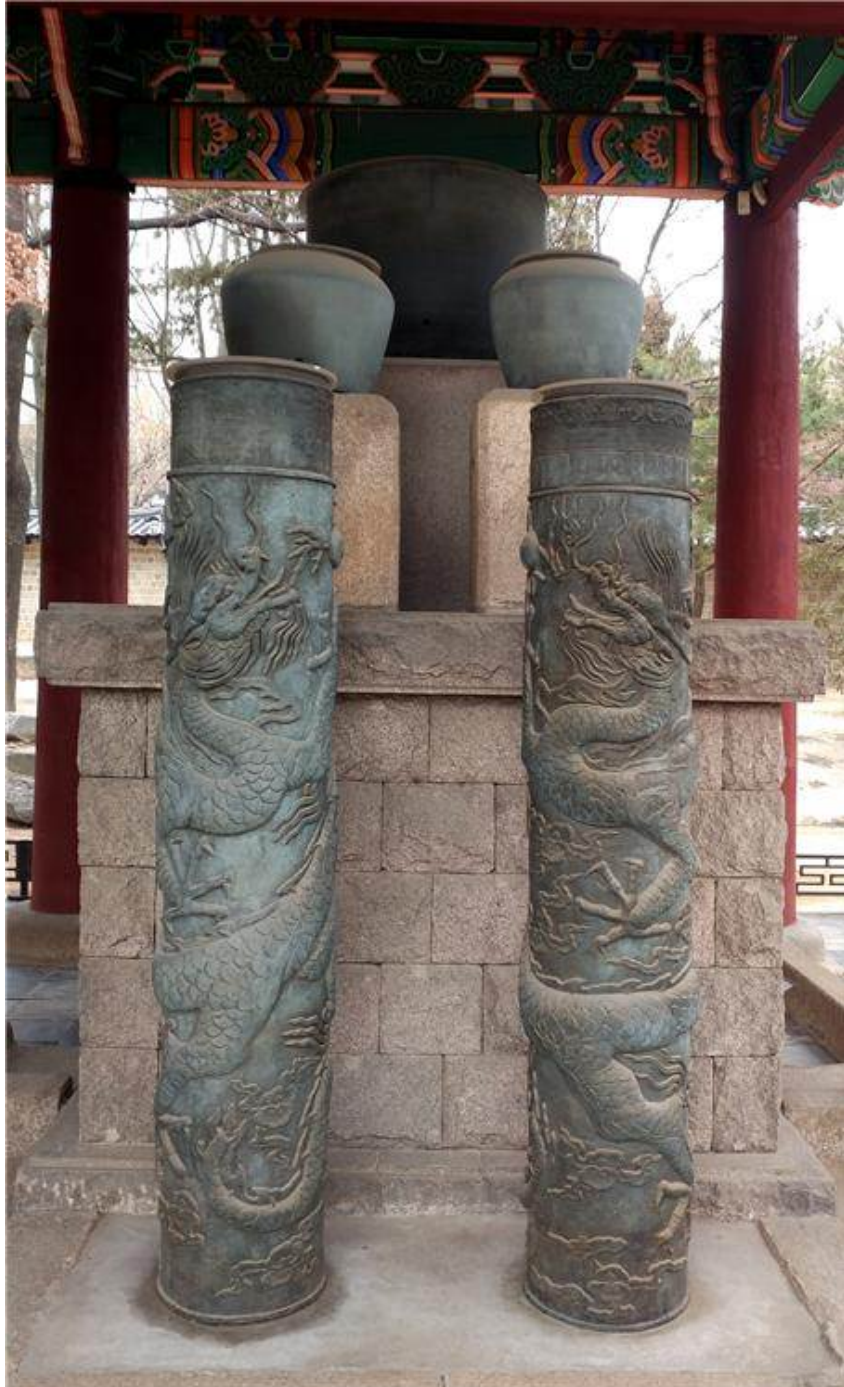
<보존처리 전 - 창경궁 자격루(국보 제229호)>