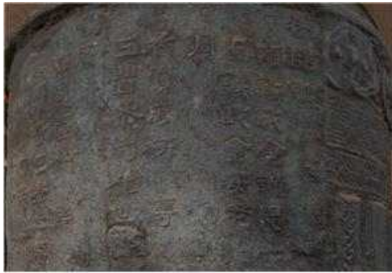
대과수호 명문 보존처리 전 · 후 비교(은입사) - 嘉靖丙申年 : 1536년