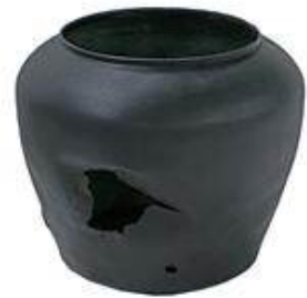
보존처리 후 - 창경궁 자격루(국보 제229호)