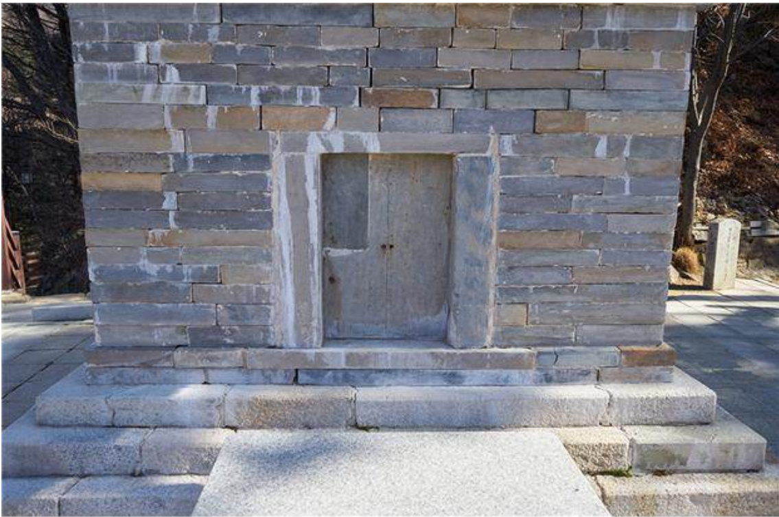
<정선 정암사 수마노탑 - 감실>