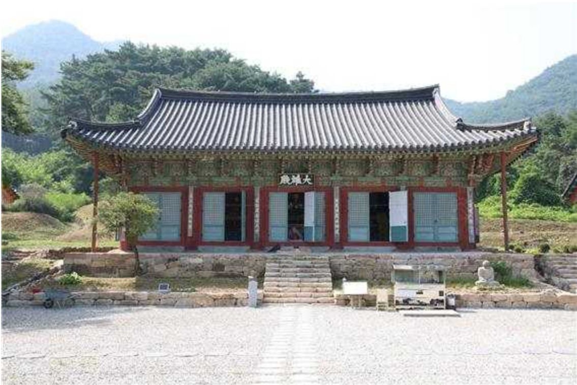
<안동 봉황사 대웅전(정면)>