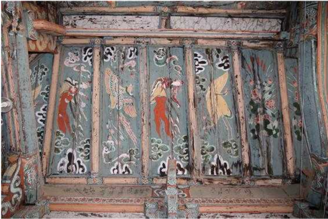
<안동 봉황사 대웅전(내부)>