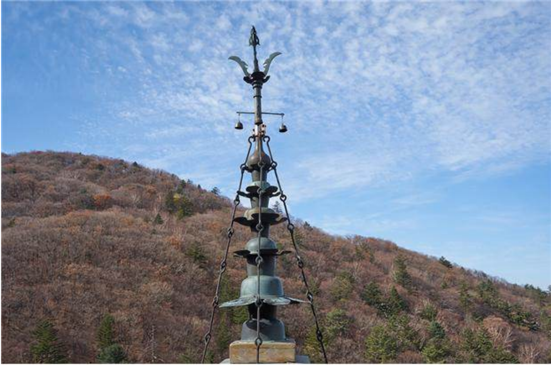
<정선 정암사 수마노탑 - 상륜부>