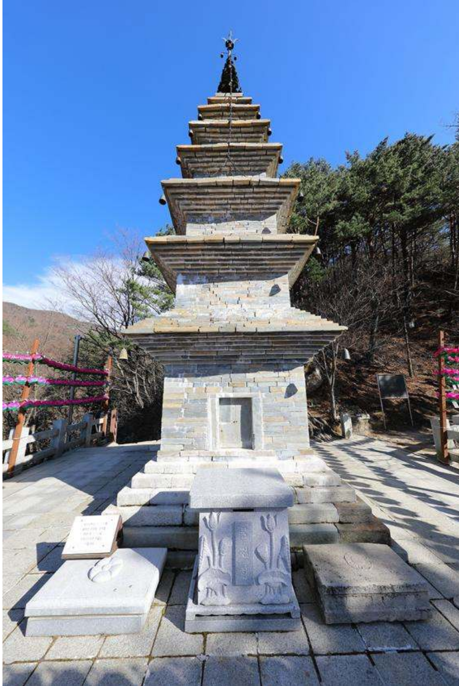
<정선 정암사 수마노탑(정면)>