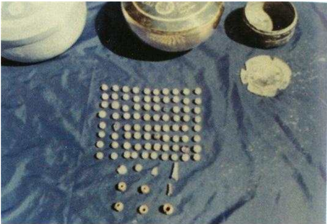
<1972년 해체 당시 염주>