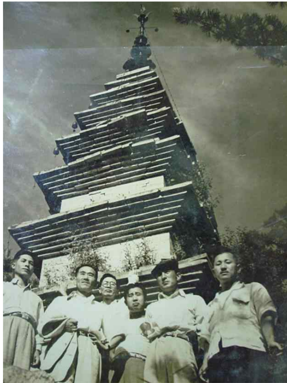
<1948년~1956년 촬영 모습>