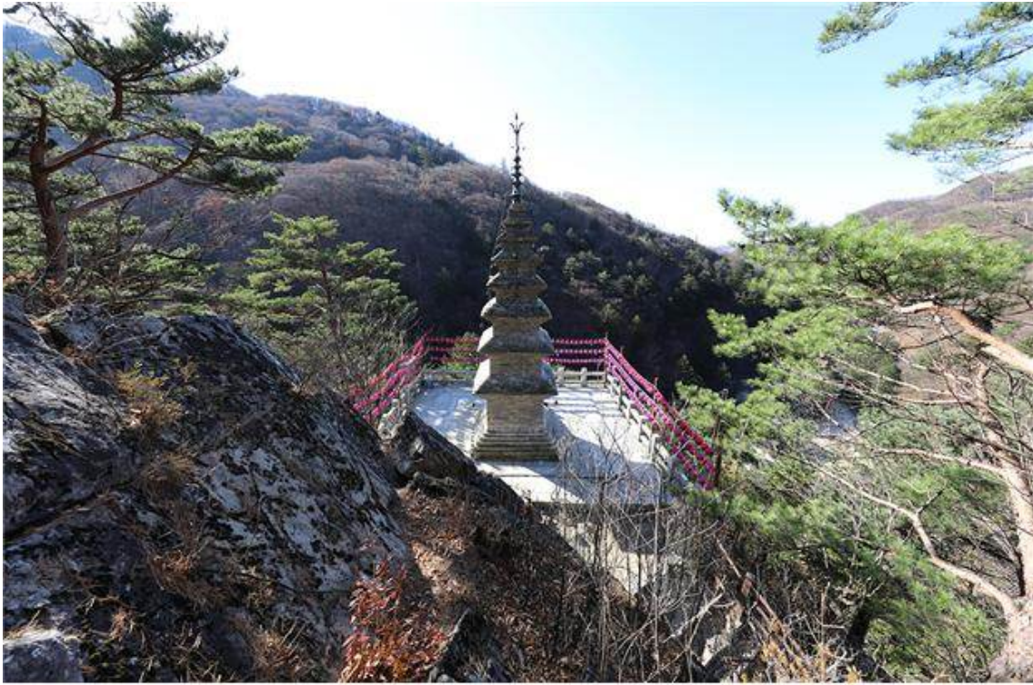
<정선 정암사 수마노탑(뒷면)>