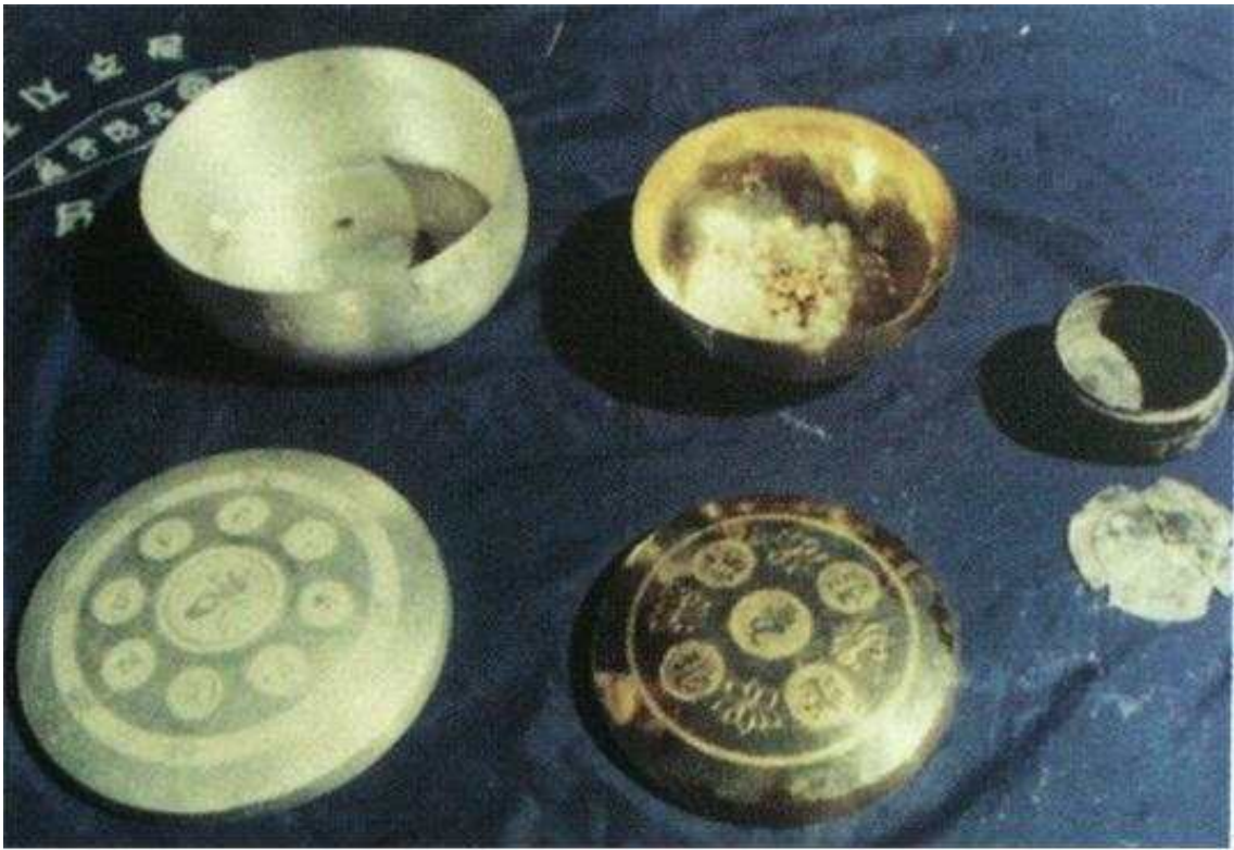
<1972년 해체 당시 금합과 은합>