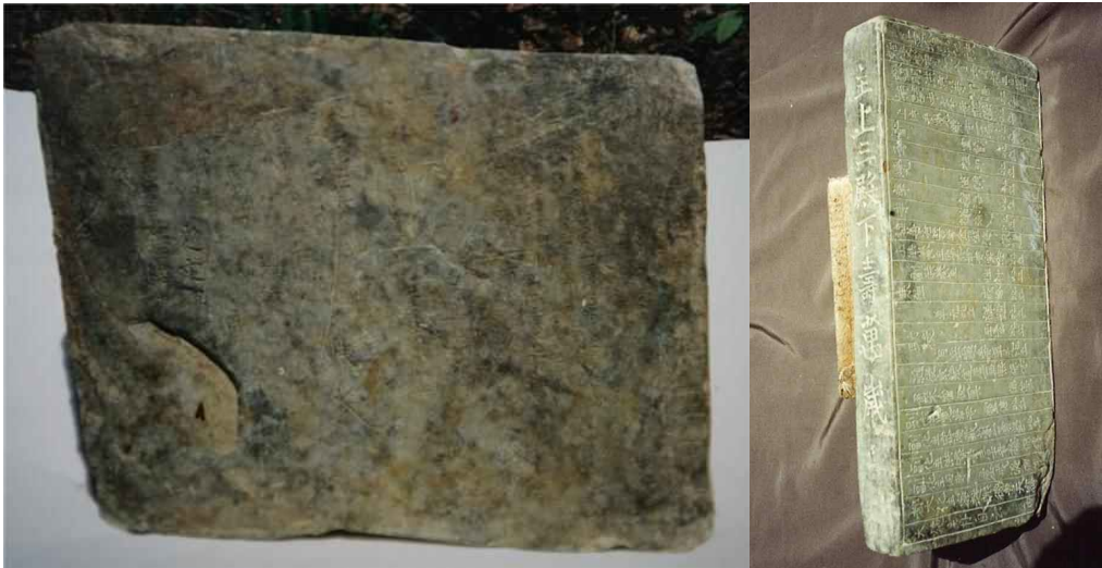
<정선 정암사 수마노탑 -제4 탑지석(왼쪽)과 제1 탑지석(오른쪽)>