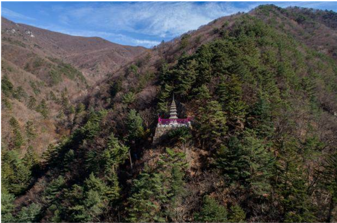
<정선 정암사 수마노탑(원경)>