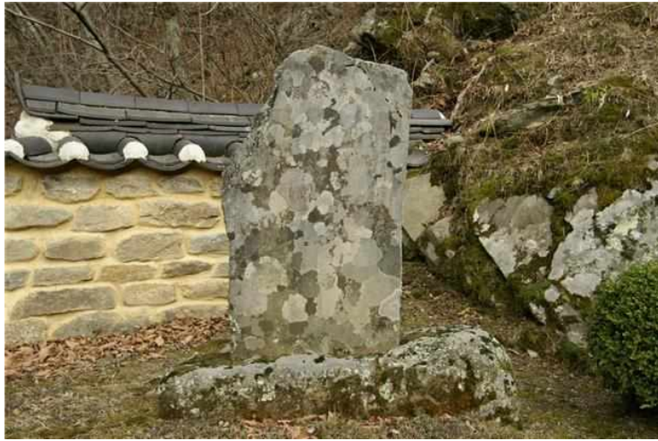
<정선 정암사 수마노탑 - 중수비>