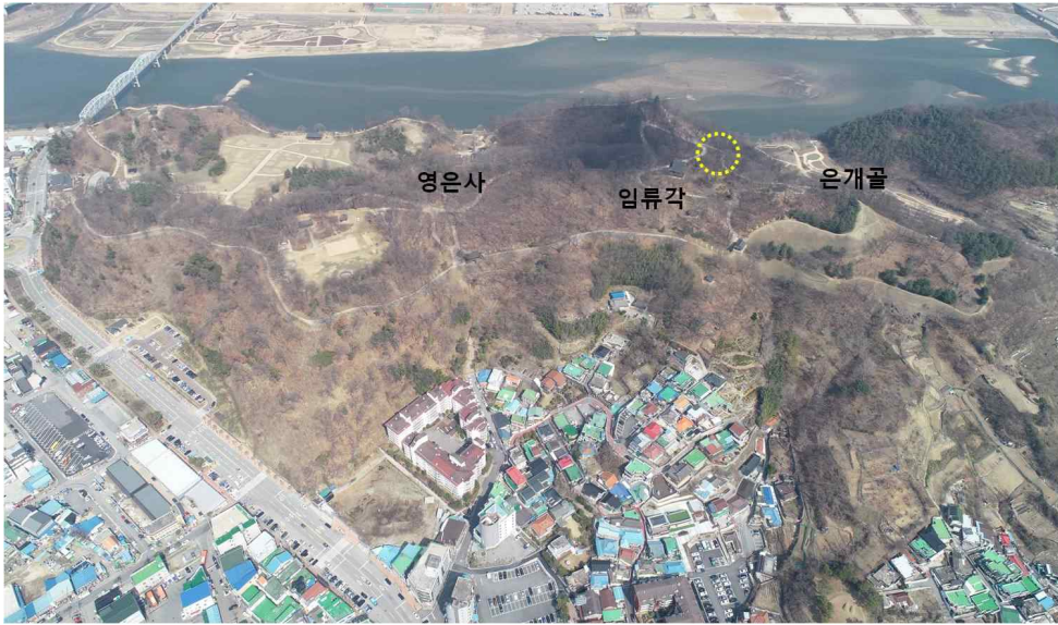
<공주 공산성(사적 제12호) 전경 및 붕괴 위치>