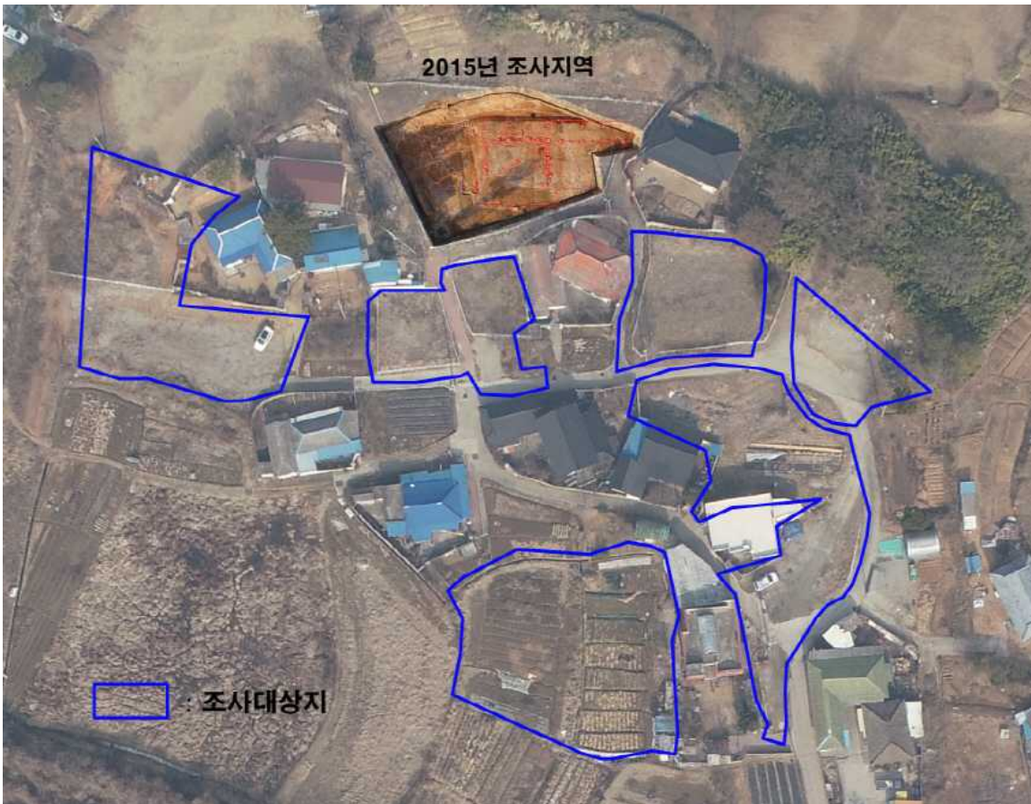
<부여 구드래 일원 조사 대상지 전경(상세)>