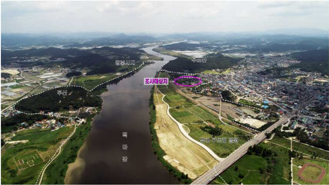
<부여 구드래 일원 조사 대상지 전경>