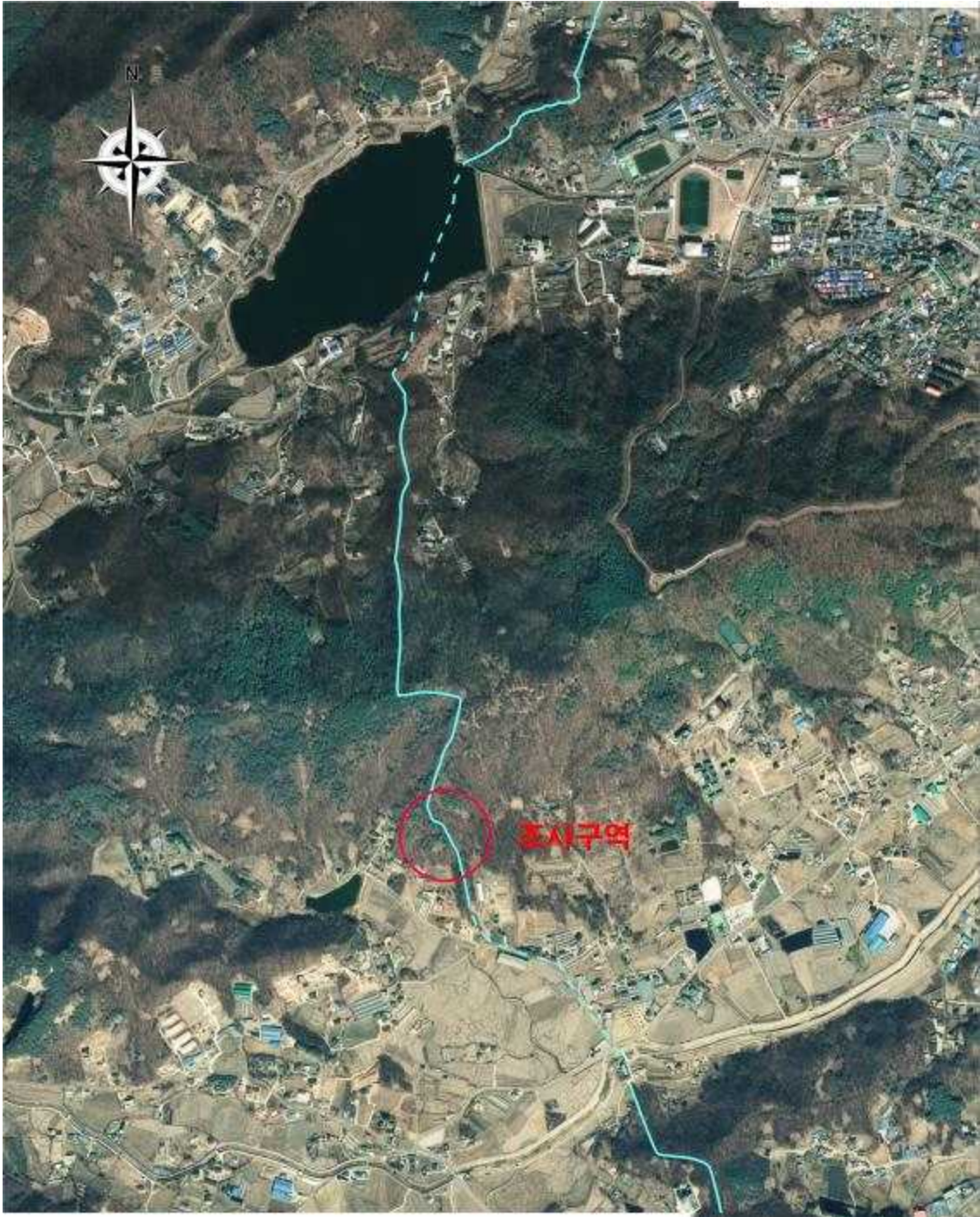
<조사구역(붉은 색 표시)>